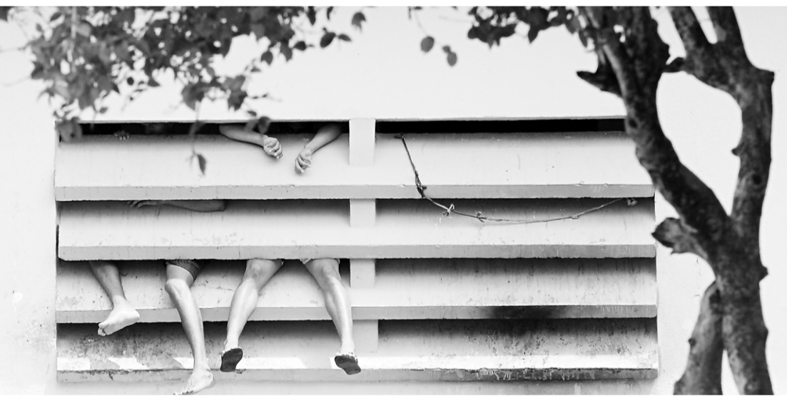
Centro Educacional do Pitimbu: interditado desde março