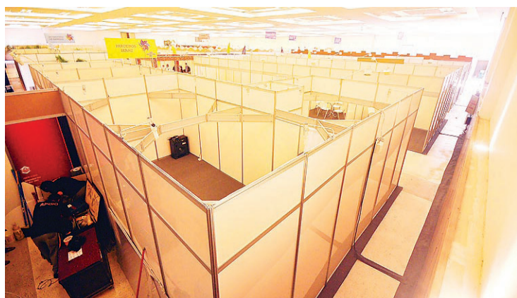
► Evento terá 75 expositores distribuídos por 4,4 mil metros quadrados

Visitantes é a expectativa de público para os quatro dias de Feira do Empreendedor