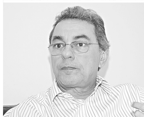
► Obery: sacrifício da folha do executivo