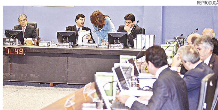
► Conselho acredita que medida se tornará exemplo nacional

das, também serão impossibilitadas de ocupar vagas comissionadas as que tiverem contas de cargos ou funções públicas rejeitadas por irregularidades, tenham o registro profissional cassado ou tenham sido demitidas de cargos públicos por justa causa. A resolução não é válida para concursados. Além da Justiça Federal, a norma será aplicada às justiças Eleitoral, Estadual, Militar e tribunais de conta. Segundo a resolução, as ve-