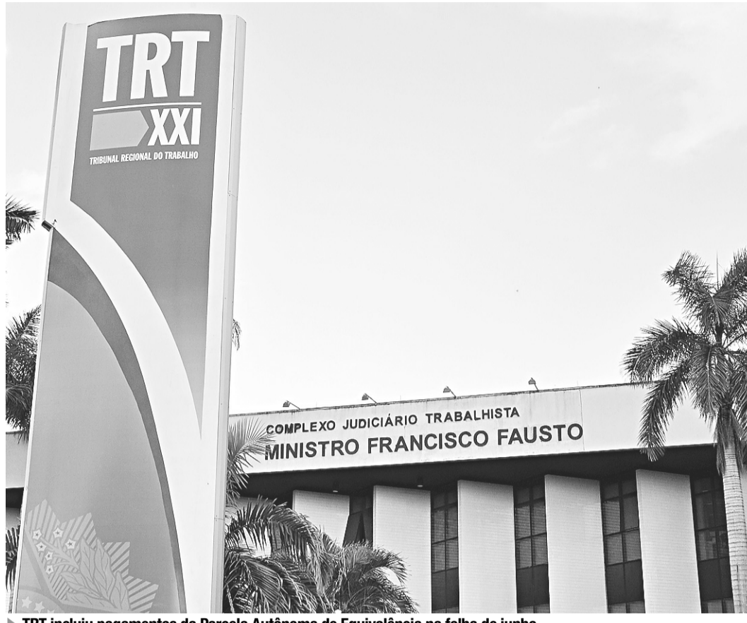
▶ TRT incluiu pagamentos da Parcela Autônoma de Equivalência na folha de junho

Os demais servidores receberam abaixo do limite previsto em lei. A maioria dos extras ad-