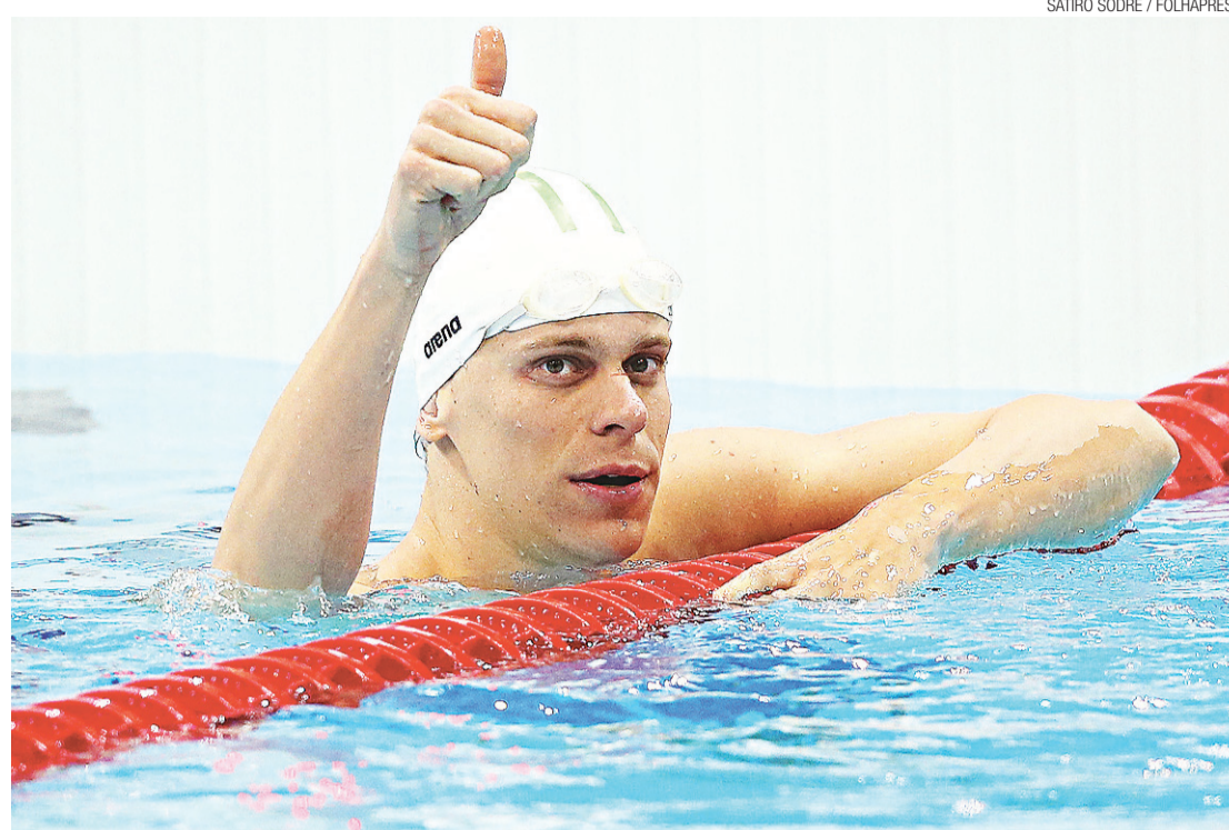
▶ Cielo se classificou na quinta posição

Em Pequim-2008, Cielo foi bronze nesta prova. "A meta