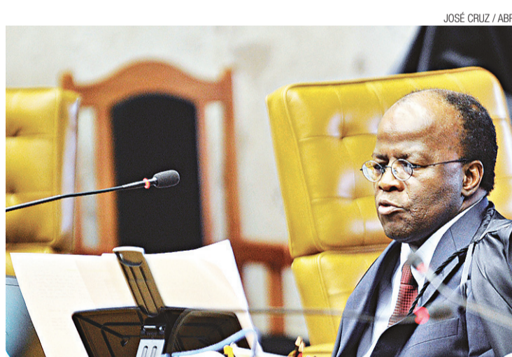
► Joaquim Barbosa, do STF, liberou acesso à tese final de Roberto Gurgel

No despacho, publicado ontem, Barbosa disse que “o memorial da acusação está disponível aos réus em meu gabinete, os