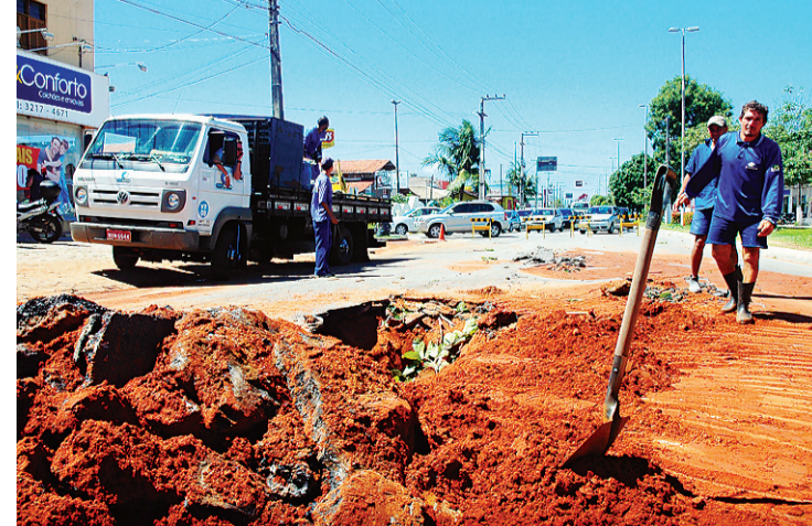
► Funcionários da Caern trabalham para consertar tubulação