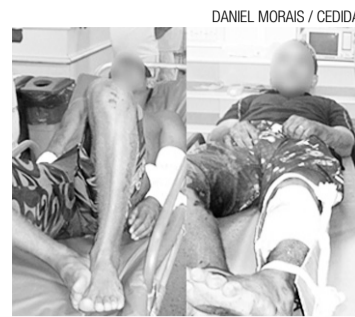
Adolescentes ficaram feridos na troca de tiro com a polícia

/ INFRATORES / DUPLA DE ADOLESCENTES TROCA TIROS COM A POLÍCIA ANTES DE SER CAPTURADA; A SAGA DOS GAROTOS EXPÕE DEFICIÊNCIAS DO SISTEMA SOCIOEDUCACIONAL DO RN