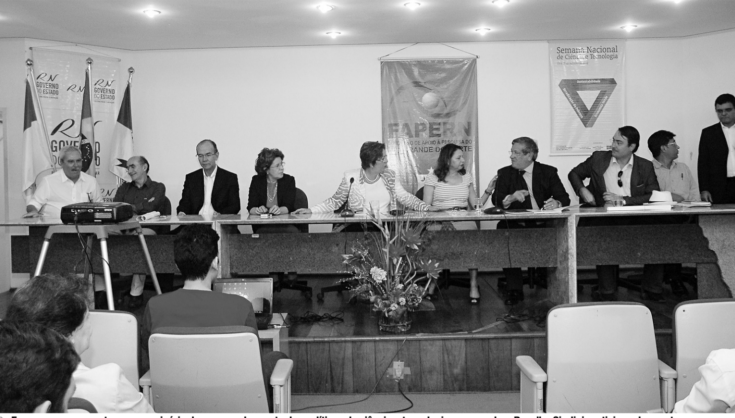
► Fapern promoveu ontem um seminário de acompanhamento das políticas de ciência e tecnologia; governadora Rosalba Ciarlini participou do evento