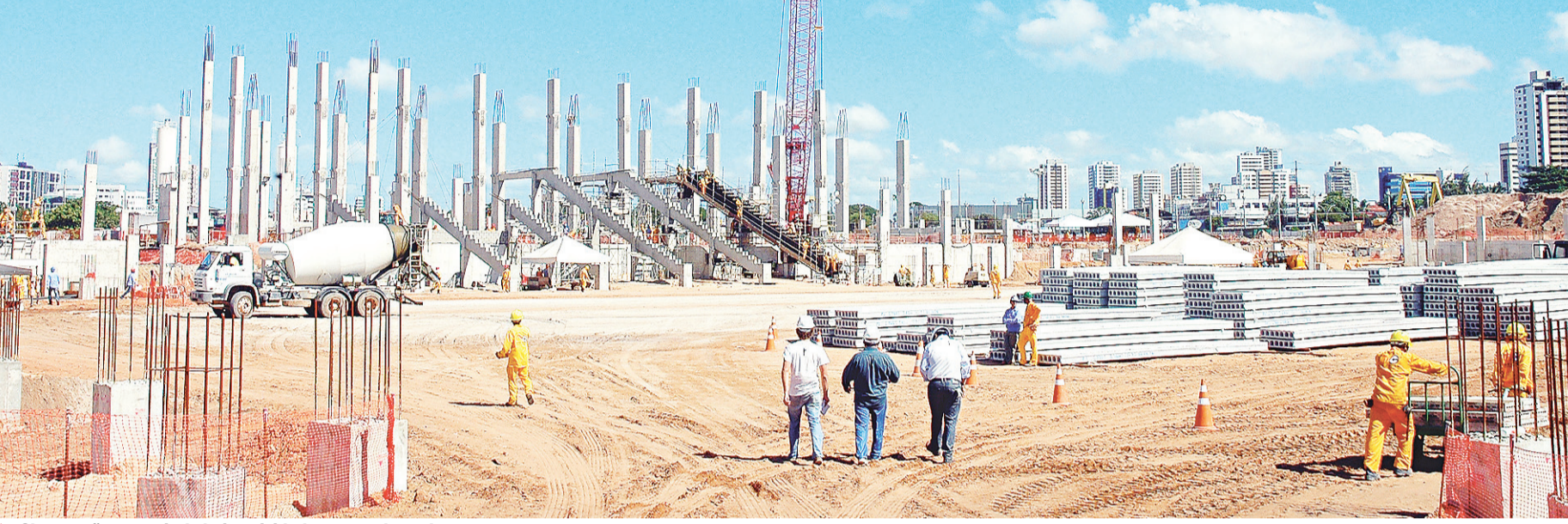
► Obras terão, a partir de hoje, atividades na madrugada

/ ESTÁDIO / OBRAS DA ARENA DAS DUNAS GANHAM TURNO EXTRA NA MADRUGADA E DEVEM TERMINAR 2012 COM METADE DA CONSTRUÇÃO CONCLUÍDA