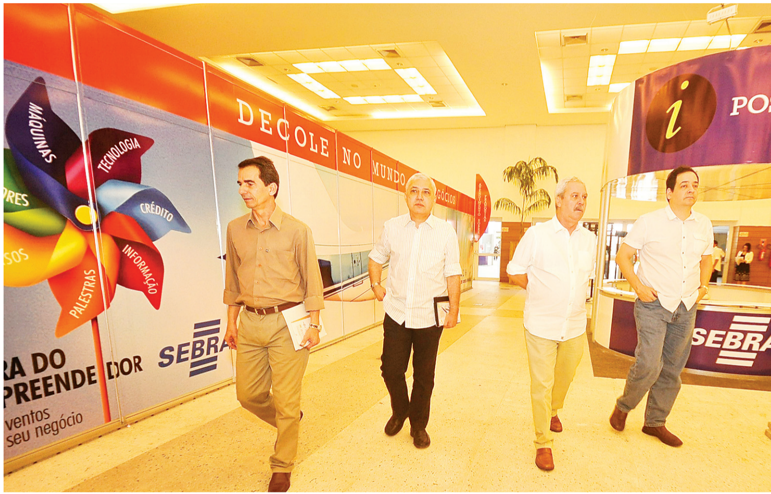
► Em visita ao Centro de Convenções, superintendente e diretores do Sebrae checam os últimos detalhes para o evento que começa hoje

Seis bancos estarão com estandes na Feira para facilitar as duas Rodadas de Negócios a serem realizadas: Serviços e Créditos para facilitar o entendimento entre as instituições financeiras e tomadores de crédito que desejam expandir, modernizar ou abrir um negócio; Território da Cidadania Mato Grande que tem por objetivo aproximar empresas, associações e cooperativas e compradores locais.