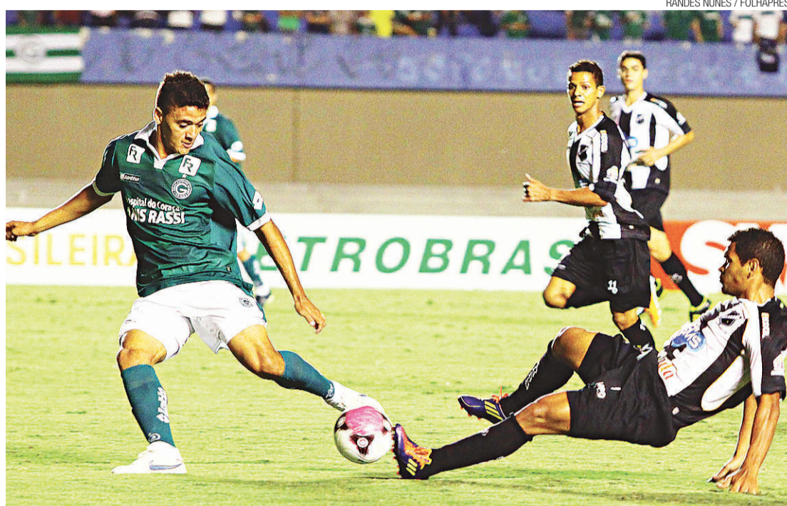
► Em jogo travado, empate contra o Goiás só saiu no segundo tempo