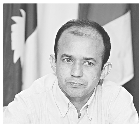
► Melquisedec: folha inflada com arsenal de sutilezas

A Parcela Antônoma de Equivalência (PAE), antigo auxílio-moradia pago aos deputados federais até 1992 e pago como vantagem eventual à magistratura, é exemplo dos ‘plus’ que elevam os rendimentos da carreira jurídica para além do teto constitucional, embora não conte no cálculo do limite máximo previsto por lei.