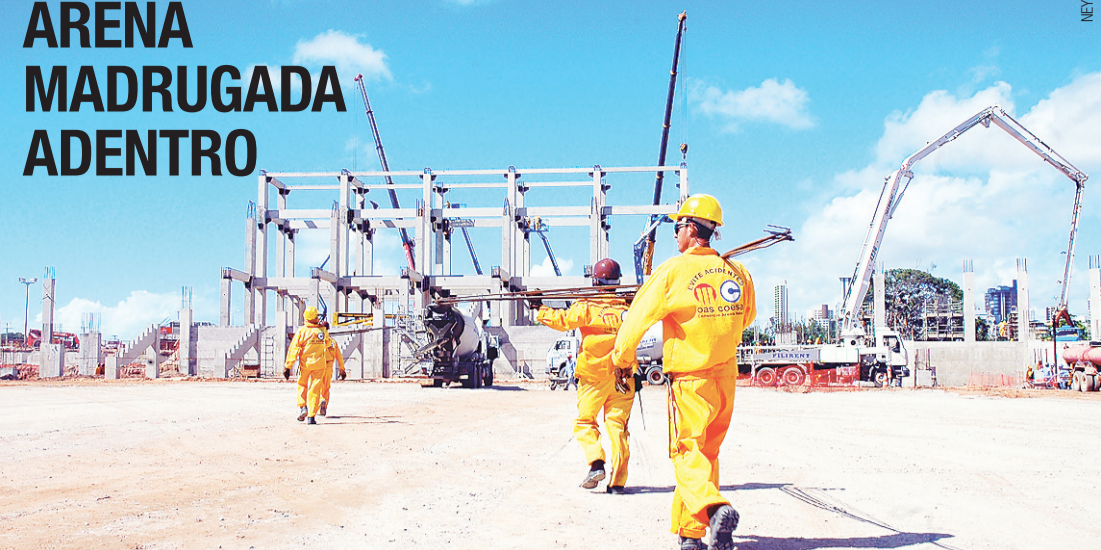
Obra ganha turno extra para acelerar serviços e concluir, até o final do ano, 50% do novo estádio de Natal