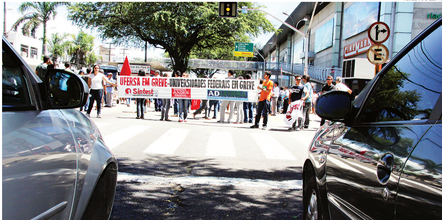
► Bloqueio das pistas gerou transtornos para a população; comando da PM disse que não vai tolerar manifestações que prejudique o direito de locomoção

Após conversa entre os dirigentes e os agentes da PF, ficou decidido que às 13h30 de ontem os portões do IFRN, fechados desde às 7h30, seriam abertos para