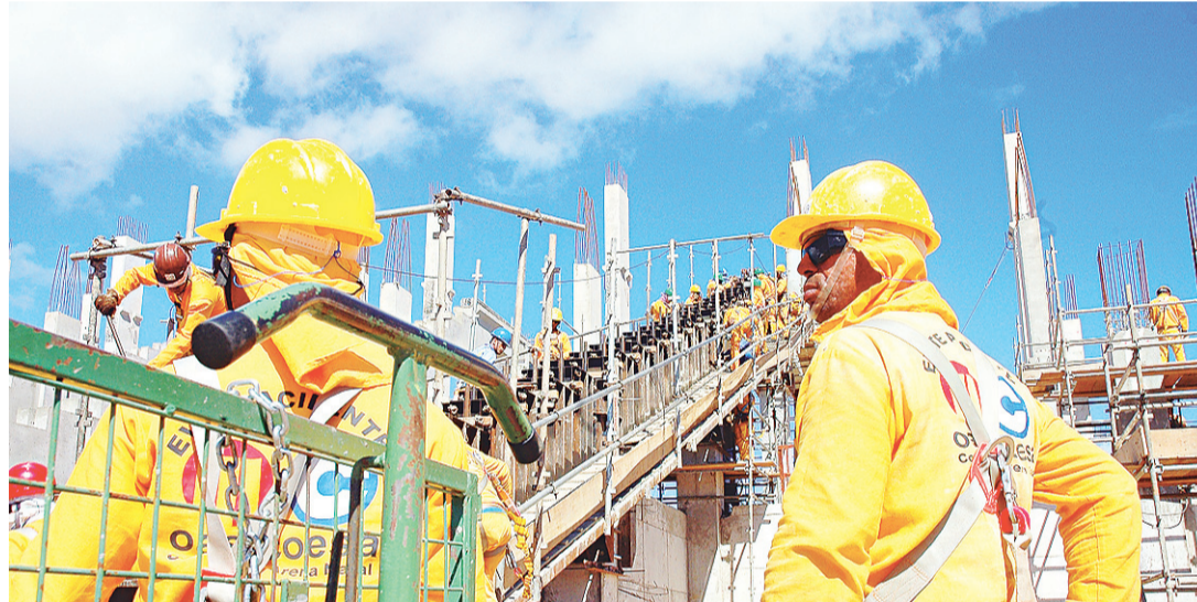
► Canteiro conta com 1.100 trabalhadores

O estádio terá capacidade para 43 mil torcedores e será palco de quatro jogos da primeira fase da Copa do Mundo 2014, nos dias 13, 16, 19 e 24 de junho. O investimento total nas obras é de R$ 417 milhões; desses, R$ 396,5 milhões são provenientes de financiamento federal.