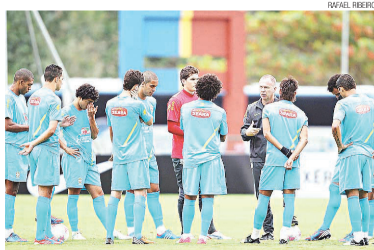
▶ Alguns jogadores devem ser poupados para o jogo de hoje

Mano pretendia usar Ganso no lugar de Oscar, mas até ontem à noite não tinha a certeza de que