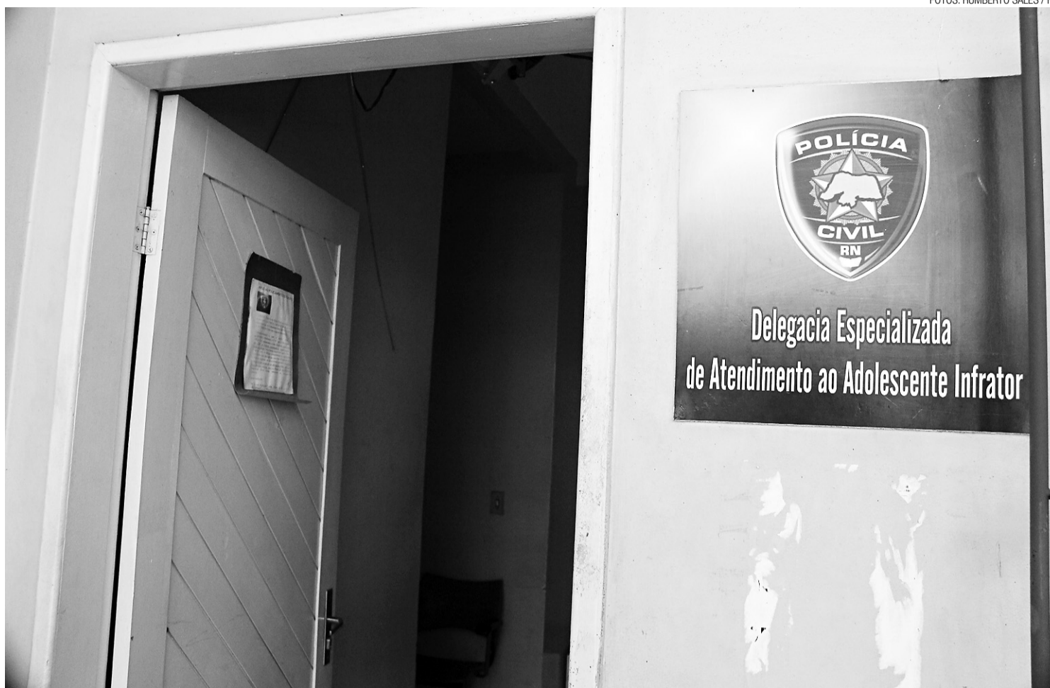
Polícia Civil tem delegacia especializada em crimes praticados pelos menores de idade

A dupla trocou tiros com a polícia no conjunto Nova Natal, Zona Norte, e acabou ferida e socorrida ao Hospital Walfredo Gurgel, onde recebe