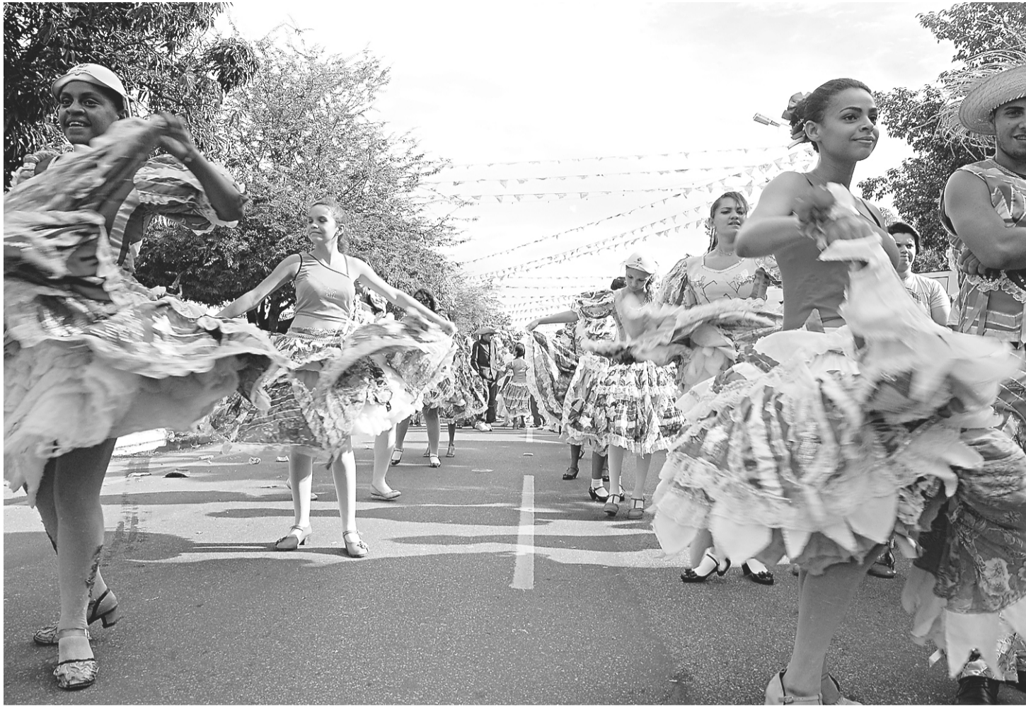
▶ Mossoró Cidade Junina é embalada não apenas pelo forró, mas bandas de rock, samba, jazz e reggae também sobem nos palcos do Corredor Cultural.

Quanto ao "Chuva de Bala no País de Mossoró", a encenação de fama nacional, que completa a dé-