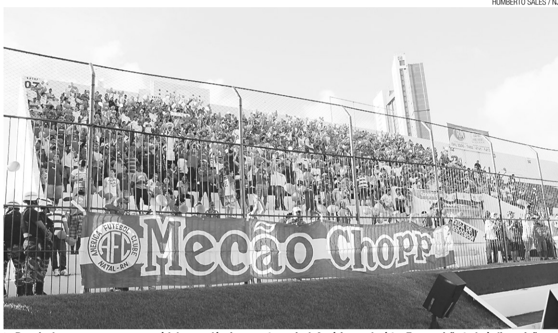
► Depois de ocupar apenas um módulo nos clássicos contra o rival, América poderá ter Frasqueirão todo à disposição

/ CONVERSAS / DIRIGENTES DE ABC E AMÉRICA CONFIRMAM NEGOCIAÇÕES PARA ALUGAR O FRASQUEIRÃO POR CERCA DE R$ 2 MILHÕES