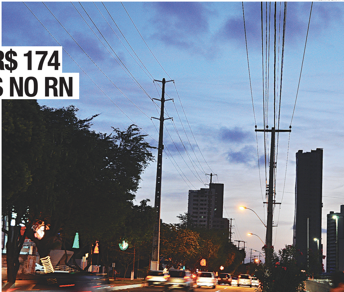
ARGEMIRO LIMA / NU

Empresa de energia supera investimento do ano anterior; quer atrair 60 mil novos clientes; e estima um crescimento de 6,45%. Entre as diretrizes para o avanço estão a expansão e renovação das redes de distribuição; melhorias na transmissão e modernização.