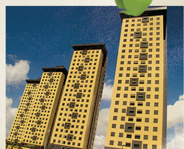
Porto do Alto

Só não somos mais pioneiros, porque a sua felicidade está sempre à nossa frente.