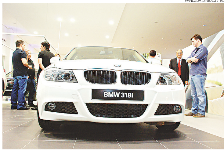
► Pesquisas detectaram potencial de consumo nesse nicho de mercado

há 45 anos no município de Timbaúba, Zona da Mata Norte de Pernambuco. Hoje o grupo tem concessionárias no Recife com as marcas Volkswagen, KIA, Yamaha e Mitsubishi. Além disso, em Caruaru há mais uma loja KIA e na Paraíba uma Nissan.