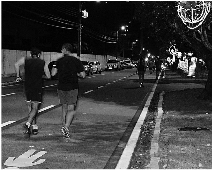
► Alameda Marilene Dantas compreende um trecho de um quilômetro

A Secretaria Municipal de Serviços Urbanos (Semsur), em parceria com o Idema, investiu em nova iluminação instalando 18 postes com lâmpadas de vapor metálico nas laterais e no canteiro central, que, por sua vez, foi contemplado com projeto paisagístico. De acordo com a prefeitura, o investimento foi de R$ 120 mil, incluindo a instalação da Acade-