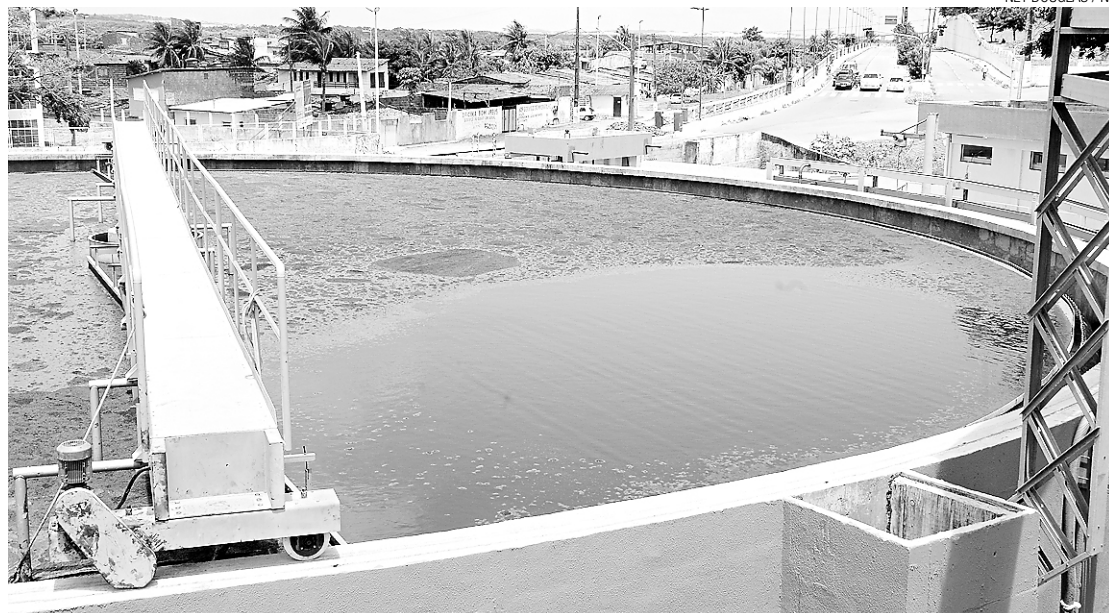
▶ O esgoto chega aos tanques da Estação da Caern, para passar pelo tratamento preliminar

Já na segunda fase são utilizados os mecanismos biológicos, onde as bactérias começam a agir absorvendo a matéria orgânica dos efluentes nos tanques anaeróbicos (sem oxigênio) e na fase final são retiradas as substâncias poluentes mais específicas que não foram eliminadas na anterior. Após sofrer este processo a água tratada será despejada no Rio Potengi.