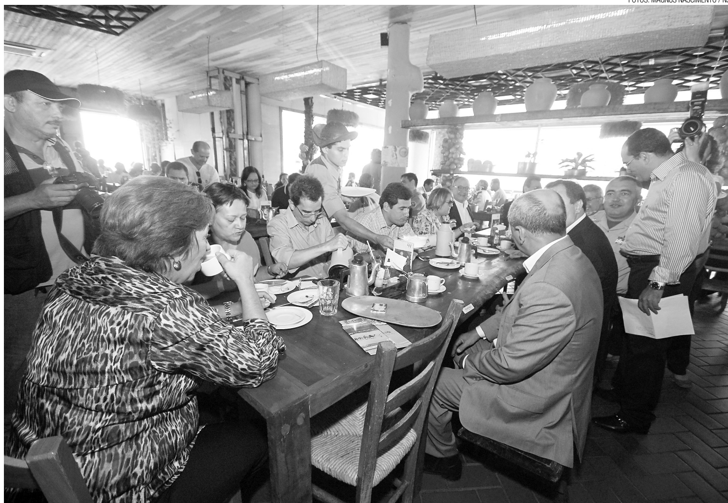
► Governadora Rosalba Ciarlini participou do lançamento da programação da Fiart, durante café da manhã oferecido ontem pelos organizadores

Ela acha que o ofício do artesanato, infelizmente, ainda carece de apoio. "Há muito que se me-