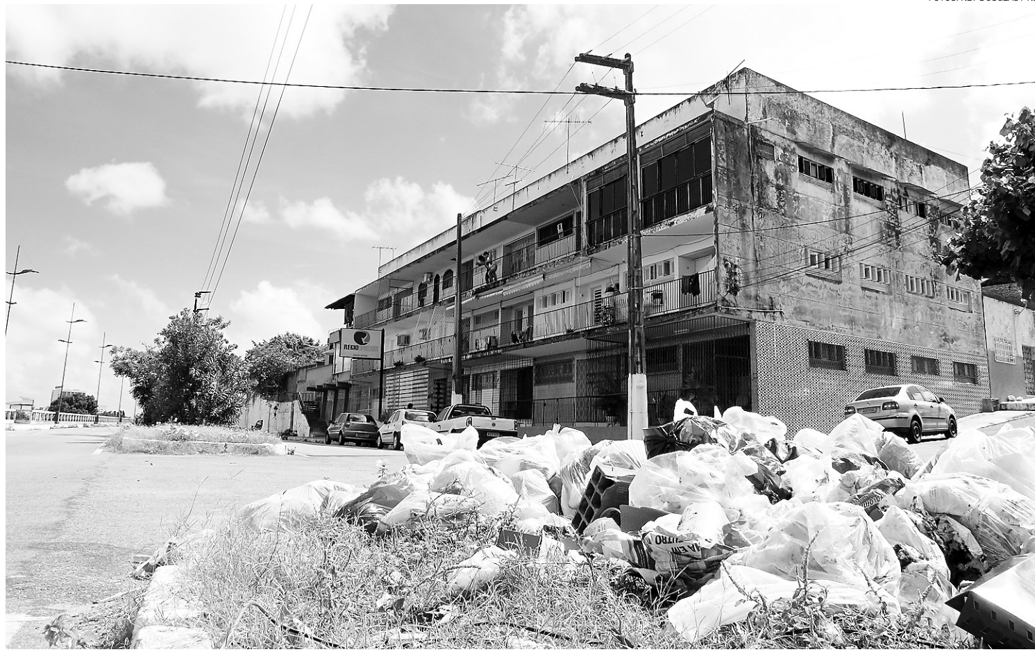
► Expectativa da Urbana é de o teto para a coleta do lixo residencial fique entre 150 e 200 litros de resíduos por dia

Em contraponto, a empresa afirma ter a receber R$ 120 milhões referentes à falta de pagamento da Taxa de Limpeza Pública (TLP). Há ainda outros números: a empresa arrecadou em 2011