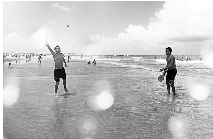
► Frescobol e kitesurf: a praticidade de um esporte e a adrenalina do outro servem de apelo sobre quem gosta de movimentar-se na praia

O "joguinho" deles costuma ser na praia de Ponta Negra, em