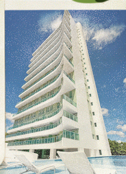
Jardins do Alto