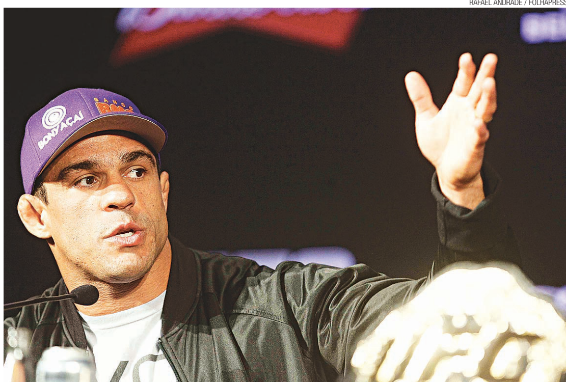
► Vitor Belfort lutará amanhã no UFC Rio

Berço do MMA (artes marciais mistas), o Rio, de longe, centraliza a prática da modalidade no país: quatro atletas que participam da segunda edição do UFC Rio, amanhã, prepararam-se no