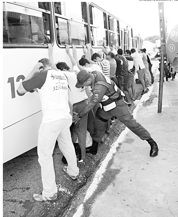
▶ Operação Transporte Seguro: 105 ônibus abordados e nenhuma apreensão

Na ação de ontem, a fiscalização foi realizada em sete pontos distintos da cidade. Barreiras foram montadas nas avenidas Bernardo Vieira, Prudente de Moraes e Dr. Mário Negócio, além da praia de Areia Preta, Posto Policial da Barreira Norte, localizado na ponte de Igapó, no Distrito de Manga-beira (Macaíba) e nas proximidades do CAIC de Parnamirim.