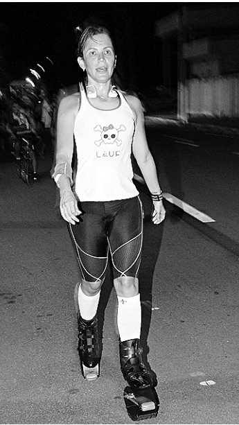
RENATO LISBOA DO NOVO JORNAL

/ TIROL / ALAMEDA MARILENE DANTAS, NA ALEXANDRINO DE ALENCAR, ATRAI NATALENSES QUE CULTIVAM O HÁBITO SAUDÁVEL DO EXERCÍCIO FÍSICO