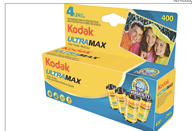
► Kodak liderava mercado de filmes fotográficos