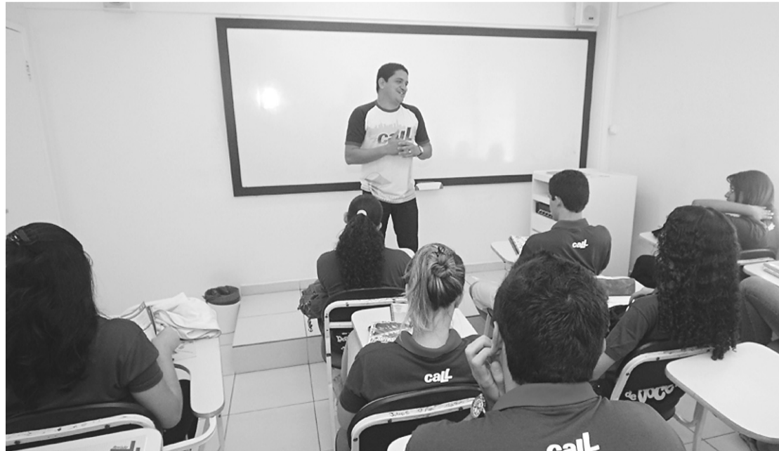
► Aulões serão realizados domingo no Ginásio Sylvio Pedroza, na Escola Estadual Atheneu, em Petrópolis, das 8h às 12h

Em cada um dos quatro módulos de aulas serão oferecidas 1.500 vagas para os estudantes. Para os dias de aulões - 6, 12, 13 e 20 de novembro -, será trabalhada uma abordagem específica nas quatro áreas de conhecimento, com o apoio de 12 professores do CALL. Segundo a Secretaria de Educação Betânia Ramalho os trabalhos metodológicos são focados essencialmente na prática. “Nos aulões de revisão, os alunos vão trabalhar a habilidade de leitura, interpretação, que são habilidades básicas que a escola deve formar e que são decisivas para qualquer estudante conseguir êxito em concursos. Então, mesmo os alunos que vão prestar vestibulares para química, física, devem