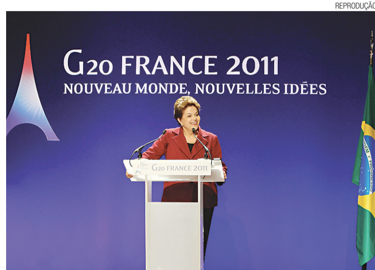
► Dilma falou no encerramento do encontro

Dilma fez um breve relato sobre os encontros bilaterais que teve ao longo dos dois dias da cúpula. Com a primeira-ministra da Alemanha, Angela Merkel, a presidenta falou sobre as relações comerciais com o país e se comprometeu a visitá-lo em março do ano que vem. As duas chefes de governo decidiram também enfatizar a importância das pequena e média empresas no Ano Brasil-Alemanha, que ocorrerá no período 2013-2014. No encontro com os líderes japoneses, um dos temas em