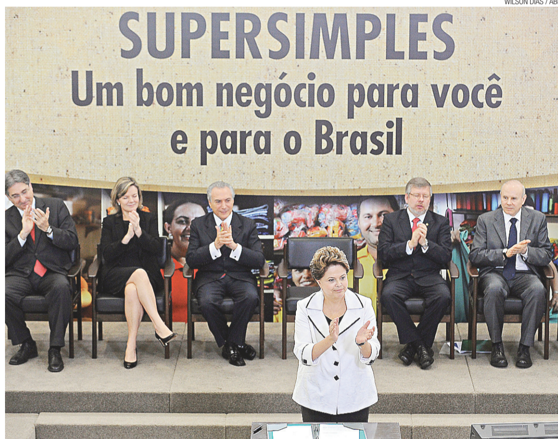
► Dilma sancionou lei so supersimples ontem

dez fiscal do Brasil e a necessidade de investimentos em infraestrutura. “Nós hoje temos uma situação muito especial no cenário internacional.”