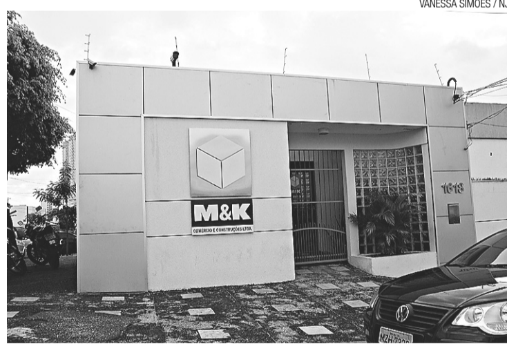
► Empresa M&K nega realização de cursos a beneficiados