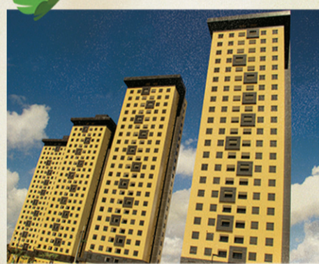
Porto do Alto

Mais do que transformar em realidade, a Estrutural transforma sonhos em felicidade.