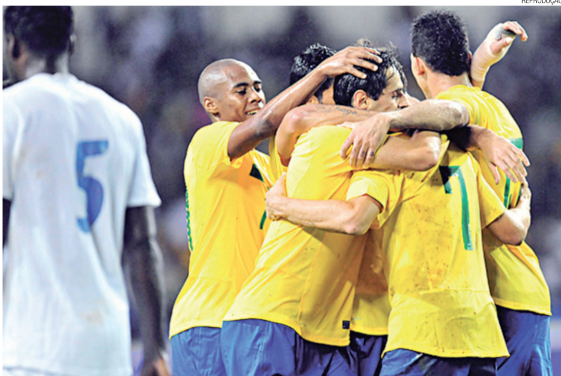
▶ Jogadores comemoram gol contra o Gabão

Mano poupou alguns jogadores considerados titulares da equipe. Apenas o zagueiro David Luiz começou o confronto entre os 11 brasileiros. Na segunda etapa, o volante Lucas Leiva também entrou.