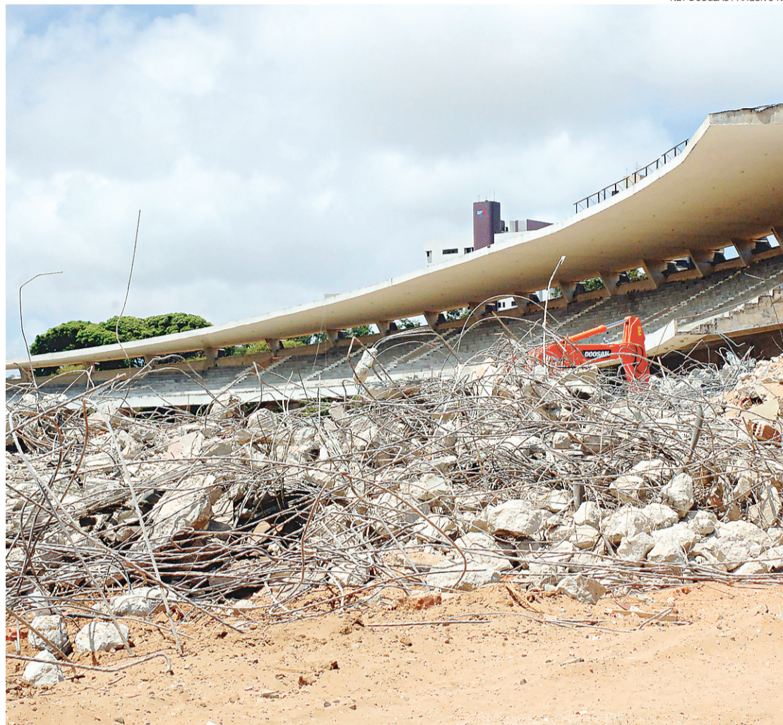
▶ Zona de exclusão abrange 1,5 quilômetro em torno do novo estádio

A restrição vai atingir 76 vias públicas. Desta forma, nem mesmo o transporte público poderá trafegar na região do perímetro, porque duas das mais importantes avenidas de escoamento veícu-