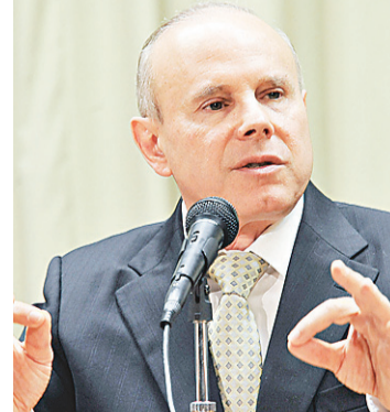
► Guido Mantega

Mantega reforçou a necessidade de o Brasil manter suas contas públicas sólidas e fortalecer a economia nacional.