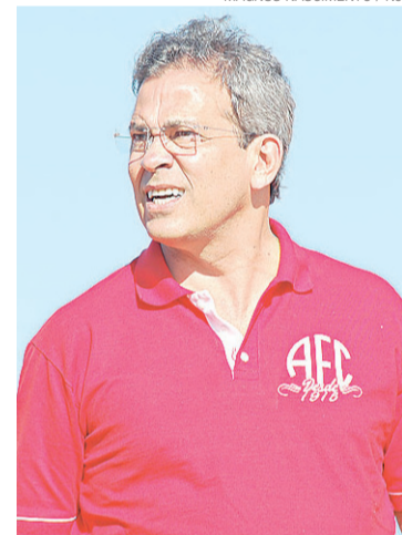
► Hermano também ao Mato Grosso