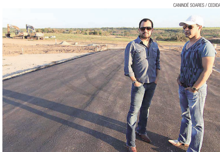
► Zezé di Camargo e Luciano vieram a Natal apresentar empreendimento