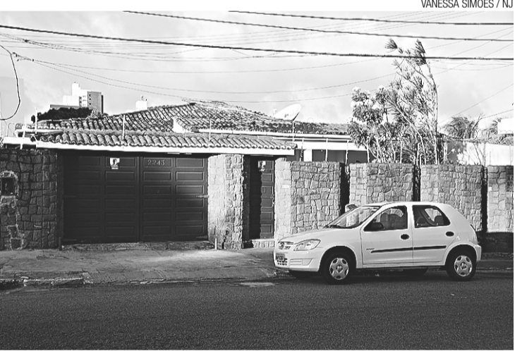
► Casa onde deveria funcionar a CTA: portas fechadas

incomunicáveis com a imprensa, ainda não foi possível saber se este prazo já está vigorando e nem as justificativas para a contratação da Cooperativa que é dirigida pela mesma presidente da ONG e que, do mesmo modo, mostrou-se suspeita ao ser procurada pelo NOVO JORNAL, como foi publicado em reportagem na edição de ontem sobre o caso.