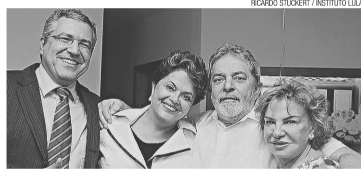
► Lula e a mulher Mariza acompanhados de Dilma e do ministro Padilha