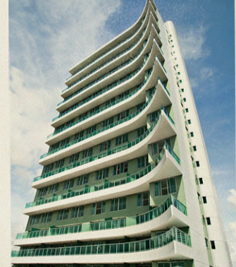
Jardins do Alto