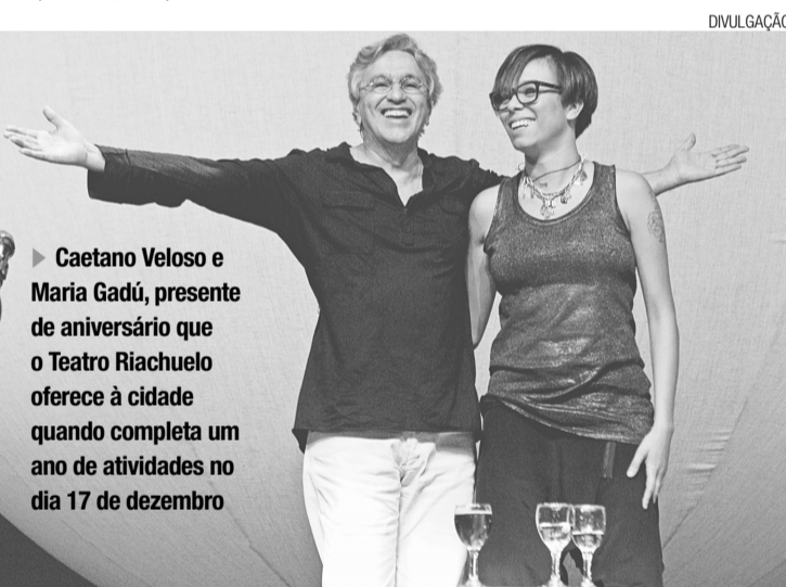
► Caetano Veloso e Maria Gadú, presente de aniversário que o Teatro Riachuelo oferece à cidade quando completa um ano de atividades no dia 17 de dezembro

Um sádico, um masoquista, um assassino, um necrófilo, um zoófilo e um piromaniaco estão sentados num banco de jardim dentro de um sanatório, sem saber como ocupar o tempo. O zoófilo teve uma idéia: - Vamos pegar um gato! - Vamos pegar um gato e torturá-lo! - sugere o sádico. - Vamos pegar um gato, torturá-lo e matá-lo! - completa o assassino. - Vamos pegar um gato, torturá-lo, matá-lo e estuprá-lo! - diz o zoófilo. - Vamos pegar um gato, torturá-lo, matá-lo, estuprá-lo e atear-lhe fogo! - anima-se o piromaniaco. Aí, o masoquista que estava calado o tempo todo, manifestou-se: - Miau!