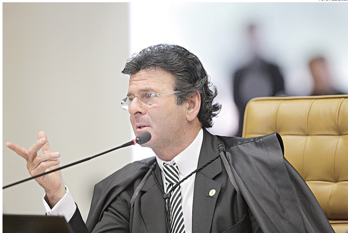
► Ministro Luiz Fux, do STF

O ministro disse ainda que seu voto tinha o objetivo de manter todas as restrições da Lei da Ficha Limpa. Para ele, não lhe parecia razoável que a renúncia a partir de uma simples petição pudesse tornar alguém inelegível. "Posso mudar. Você sempre reflete sobre a repercussão da decisão. Então, até o