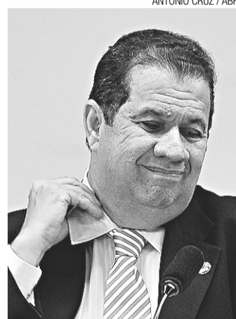
► Carlos Lupi depois na Câmara

O ministro disse ainda que tentam derrubá-lo desde que