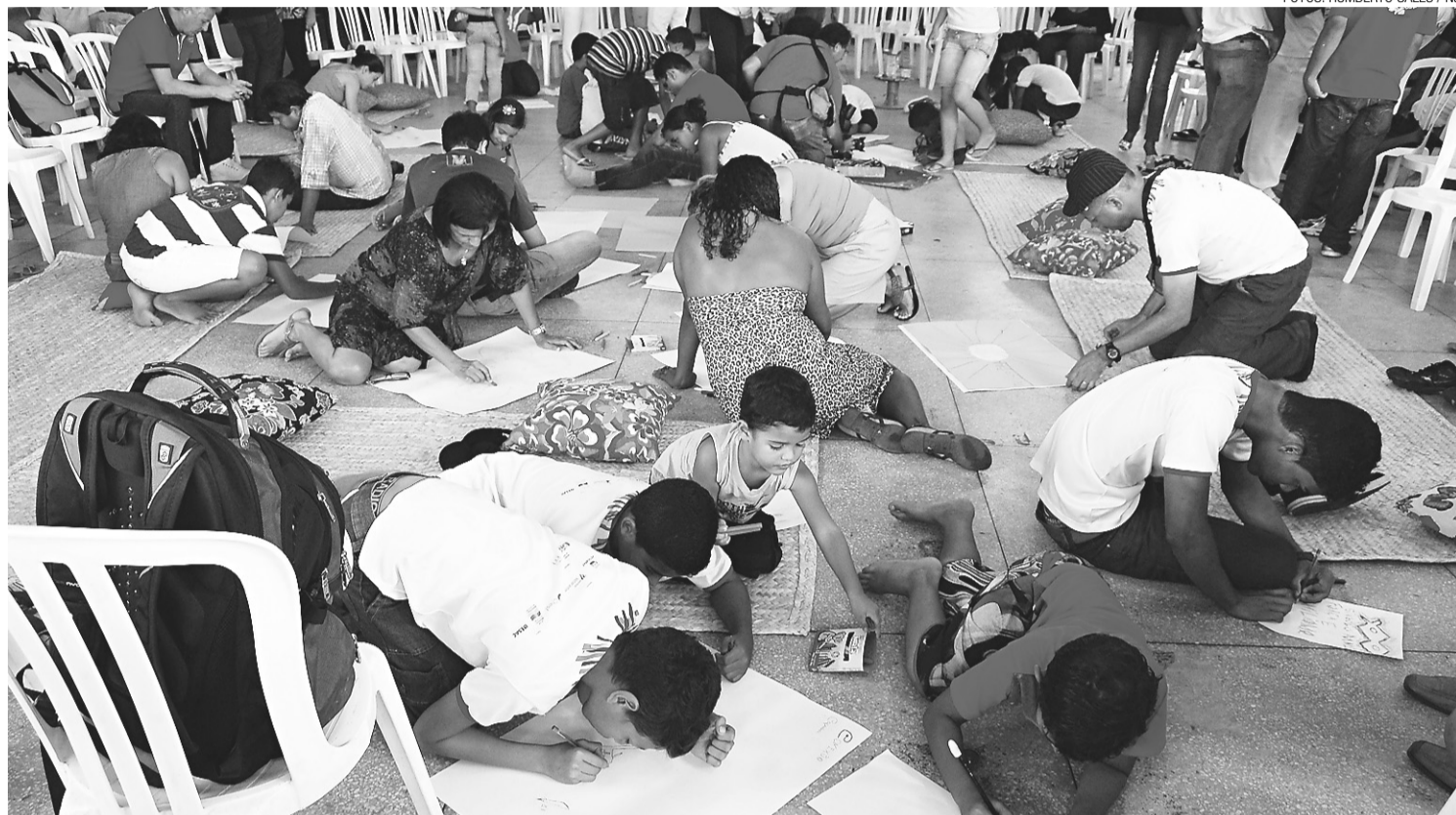
Projeto Conexão Felipe Camarão é desenvolvido em oito escolas públicas do bairro, contemplando 400 estudantes