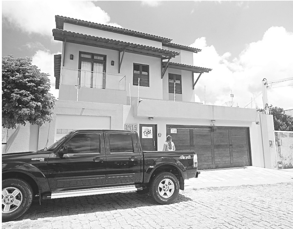
► Êpa perdeu convênios e agora terá que devolver dinheiro ao Ministério

De acordo com o Ministério do Trabalho, a impessoalidade é um dos princípios que regem a Administração Pública e deveria ter sido considerada pelo instituto, uma vez que passou a gerir recursos públicos, no momento em que firmou os convênios. Além da não observação do princípio da impessoalidade o MTE informou ao NOVO JORNAL que foram constatados outros descum-