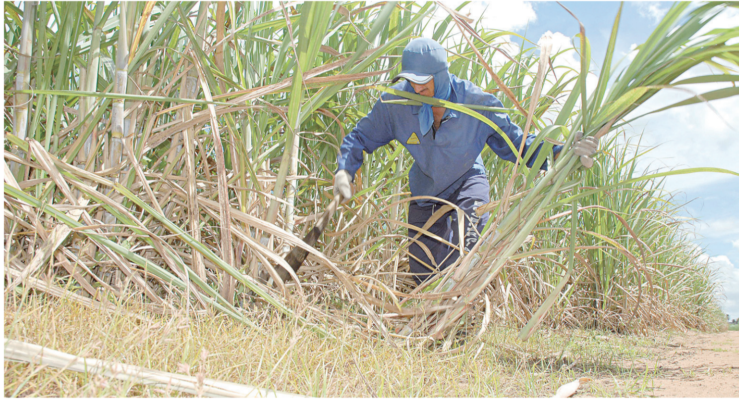
▶ Início da safra de cana ajudou na geração de empregos em setembro