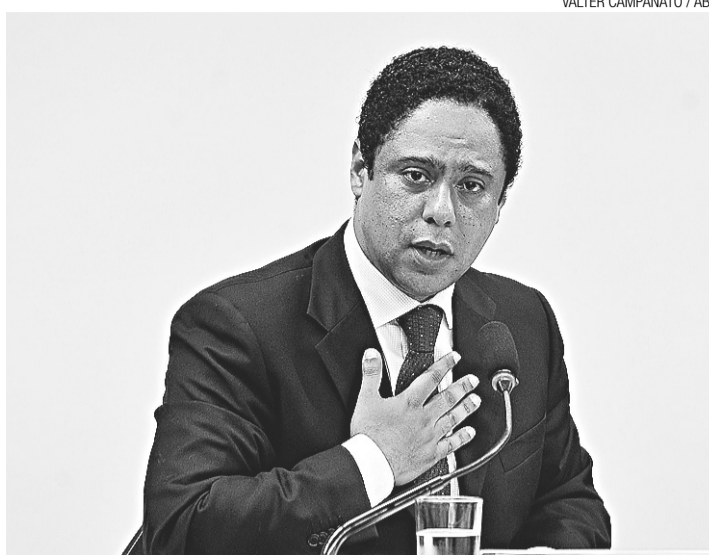
► Orlando Silva se defende em audiência na Câmara dos Deputados

Silva disse que vai pedir ao Ministério Público e ao Tribunal de Contas da União para "acelerar" os trâmites das ações contra o policial militar, que pode precisar reembolsar os cofres públicos com os recursos que haviam sido repassados pelo programa Segundo Tempo e