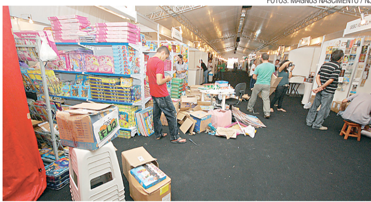
► Feira do Livro e Quadrinhos (FLiQ) continua até sexta-feira na UFRN

No festival da literatura e dos quadrinhos, as fantasias e os fantasiados são prefêreos: estão localizados logo no início do corredor de estandes montados no primeiro de quatro pavilhões que compõe a Feira de Ciências e Tecnologia da UFRN (Cientec). O convite para que eles integrassem a FLiQ foi pensado pela organização como