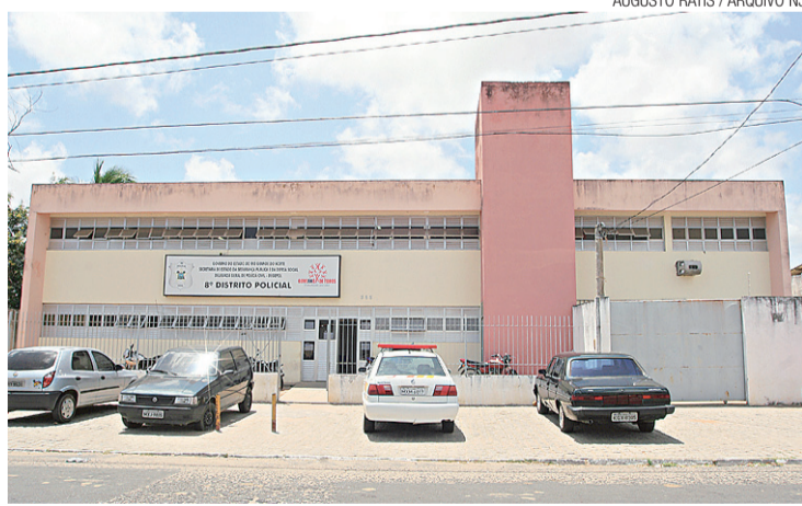
► Plantão sairá da Cidade da Esperança

E a solução custou a sair. O embate sobre o futuro da Delegacia de Plantão da Zona Sul começou