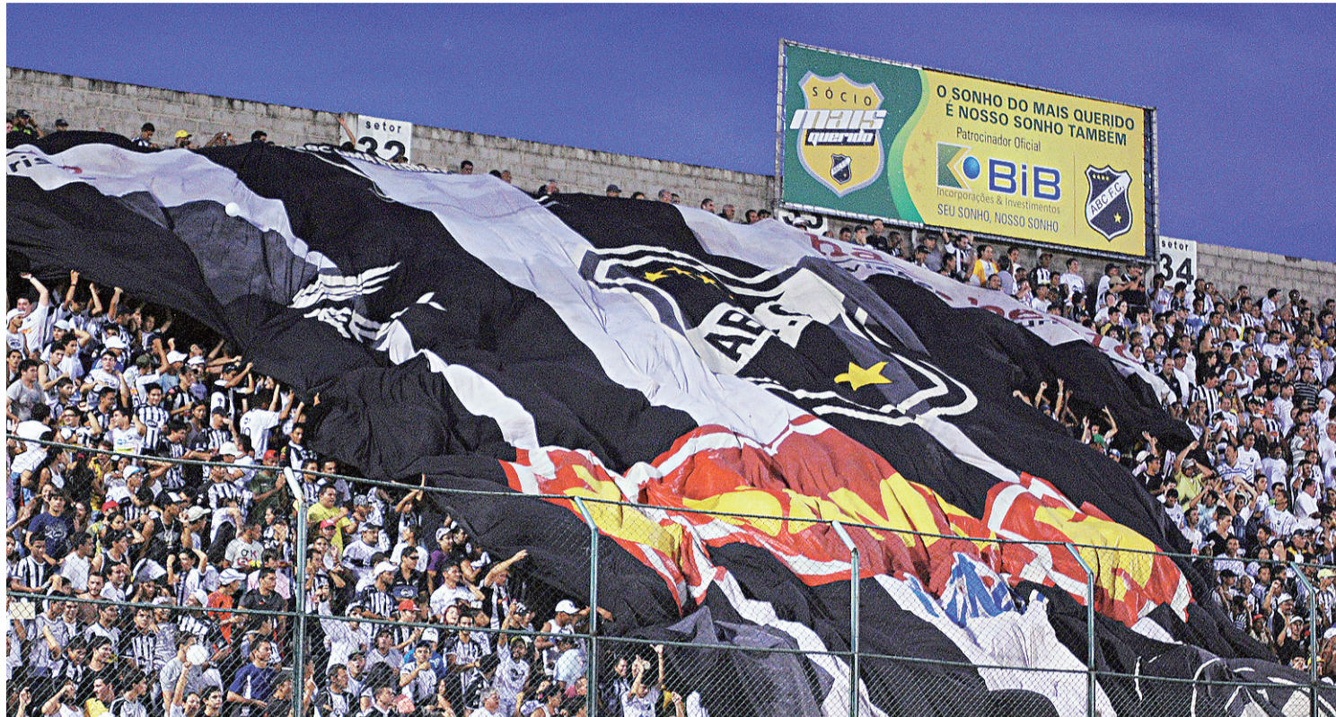
▶ Frasqueirão lotado é arma do ABC