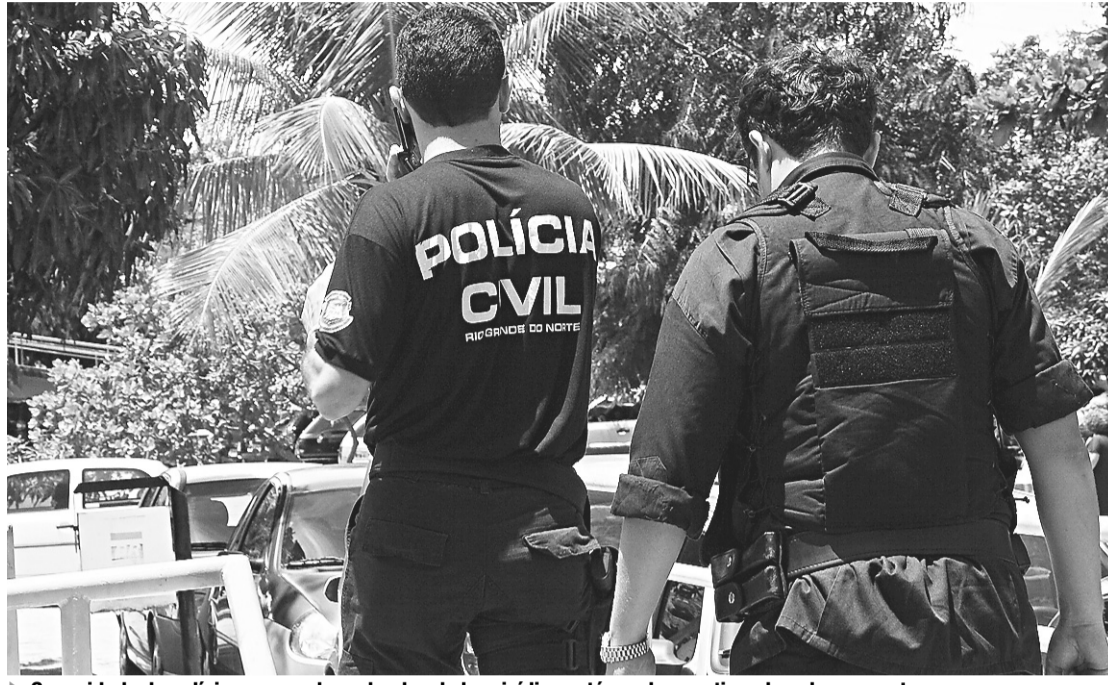
▶ Capacidade da polícia em prender culpados de homicídios está sendo questionada pelos promotores

E este número só tende a subir. Afinal, a meta da Polícia Civil é dar uma satisfação para todos os 1.171 crimes desengavetados – investigações de assassinatos praticados antes de 2008 que precisam ser remetidos ao Ministério Público antes de o ano acabar; seja solicitando a realização de novas diligências, oferecendo denúncias contra supostos envolvidos ou, simplesmente, considerando o caso encerrado por falta de provas ou evi-