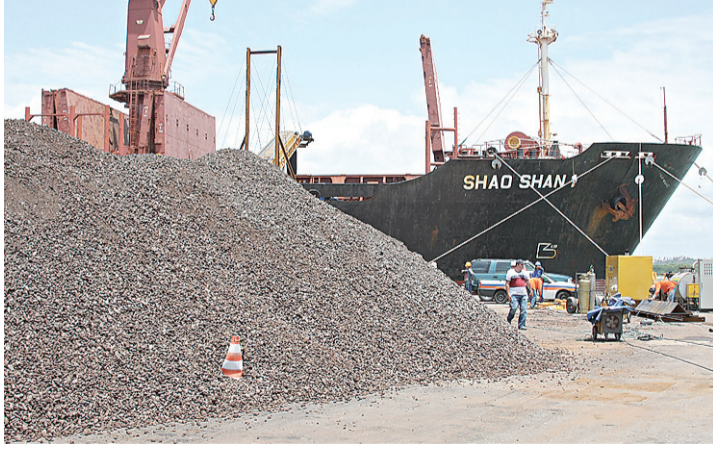
▶ Minério produzido no RN pode render mais royalties

O novo marco legal da mineração, que está praticamente pronto no Executivo, fixa banda de 0,5% a 6% para os royalties do setor. A média atualmente é de 2%, varia de acordo com o minério. O decreto que irá definir as alíquotas também está pronto. Define 4% para o minério de ferro -a taxa hoje é de 2%. Para a pedregulho do minério, produto mais beneficiado, a alíquota será de 2% -para incentivar a agregação de valor em território nacional.