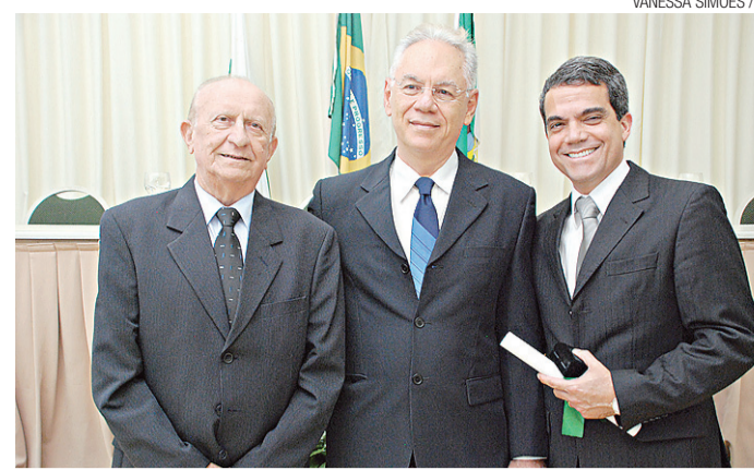
► Homenageados receberam comenda "Professor Onofre Lopes da Silva"