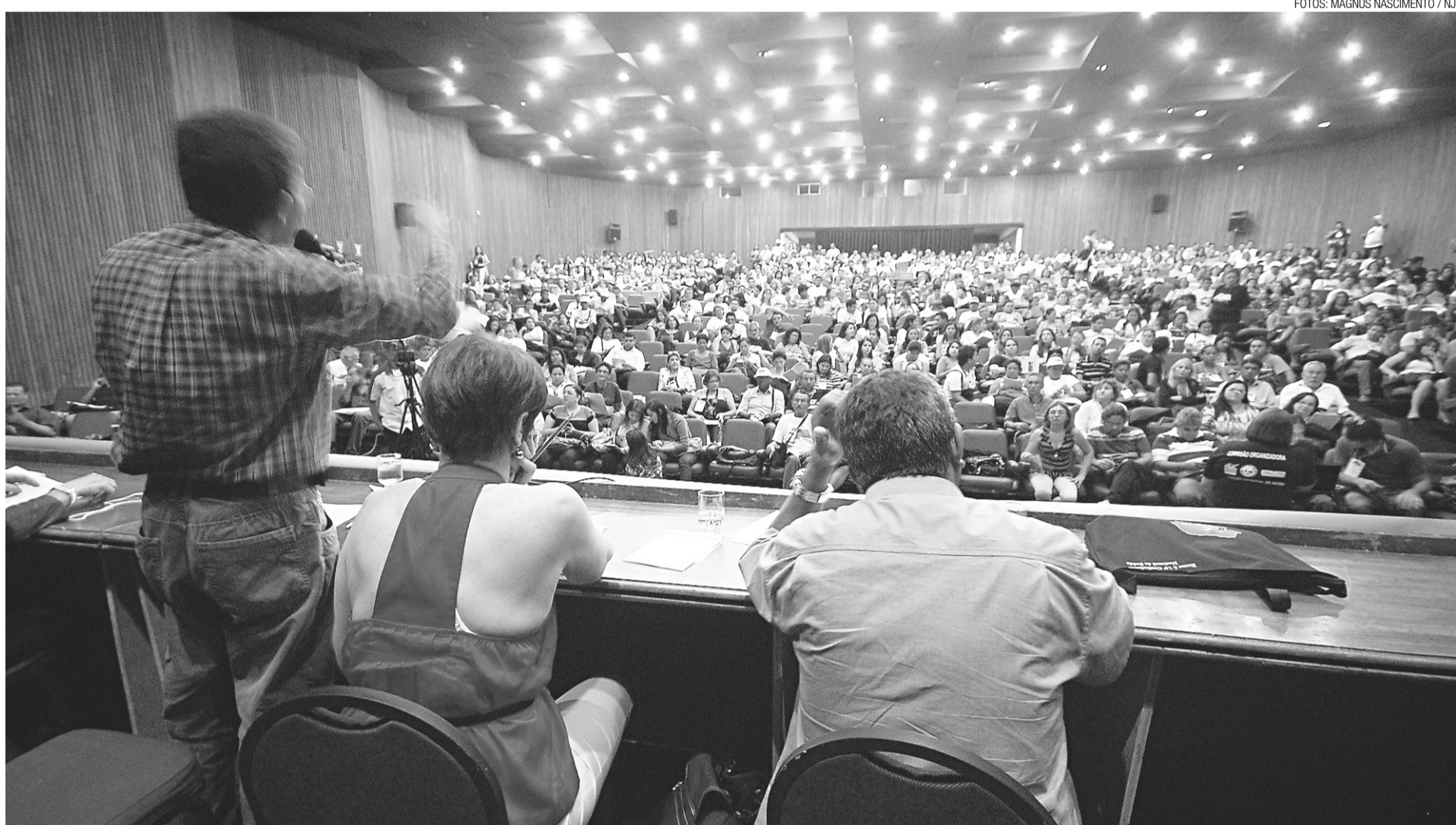
▶ 7ª Conferência Estadual de Saúde, evento realizado até hoje no Centro de Convenções da Via Costeira