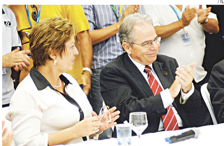
▶ Presidente da Infraero reuniu-se com a governadora Rosalba Ciarlini

“O aeroporto vai ficar com a capacidade para atender 5,2 milhões de passageiros nos próximos três anos e depois as autoridades vão decidir o que será feito. Mas eu não descar-