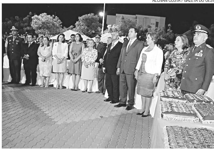
Solenidade para instalação da sede do governo em Mossoró

tência, a prefeita mossoroense Fafá Rosado ofereceu um almoço para a governadora do Rio Grande do Norte e também para o vice-governador Robinson Faria (PSD) que desembarcou em Mossoró acompanhando Rosalba no início da tarde de ontem no aeroporto Dix-Sept Rosado.