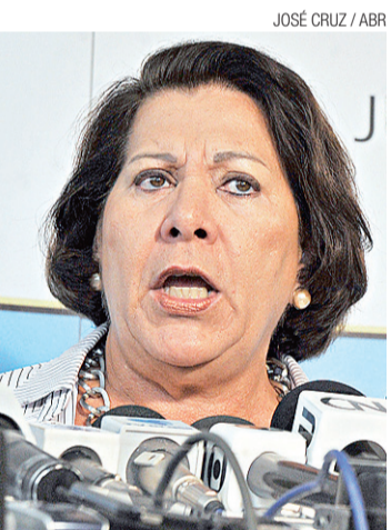
Ministra Eliana Calmon

Ela havia dito que um possível esvaziamento do CNJ seria "o primeiro caminho para a impunidade da magistratura, que hoje está com gravíssimos problemas de infiltração de bandidos que estão escondidos atrás da toga".