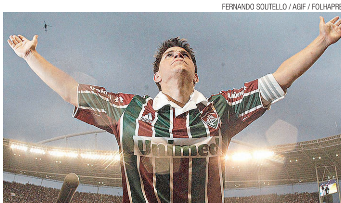
Conca, que conquistou o Brasileirão pelo Flu, é campeão na China

Desde então, seu governo autorizou a compra de telefones celulares por cubanos, reduziu a burocracia para conceder títulos de propriedade de imóveis e concedeu 250 mil licenças para pequenos negócios privados.