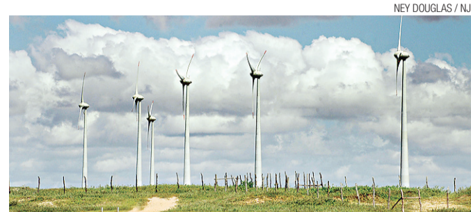
▶ Novo leilão de eólica será em dezembro