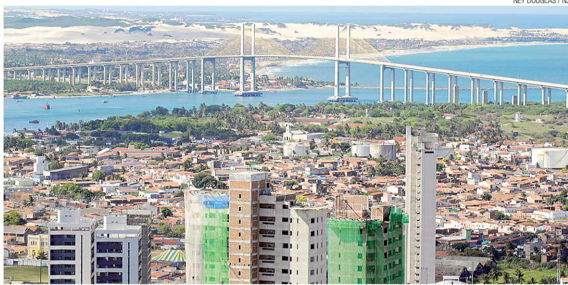
▶ Prefeitura lançou mais cem mil novos imóveis no cadastro da cobrança de IPTU este ano