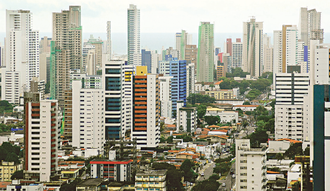
NEY DOUGLAS / NU

► Prefeitura estuda cobrar dos contribuintes retroativamente por alterações feitas em imóveis a partir de 2006