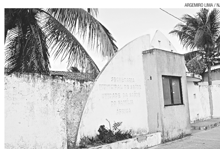
▶ Posto na comunidade da África retrata situação das unidades públicas

Não muito longe dali, no bairro da Redinha, às 16 horas, a Unidade Básica de Saúde estava fechada. O expediente, no entanto, segundo uma Auxiliar de Serviços Gerais deveria ser até as 17 horas.