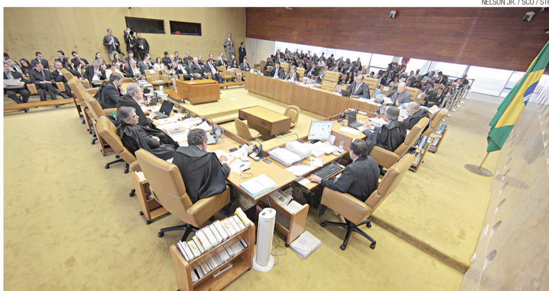
Ministros do STF adiam decisão sobre o CNJ

A ideia é definir parâmetros para indicar em que circunstâncias