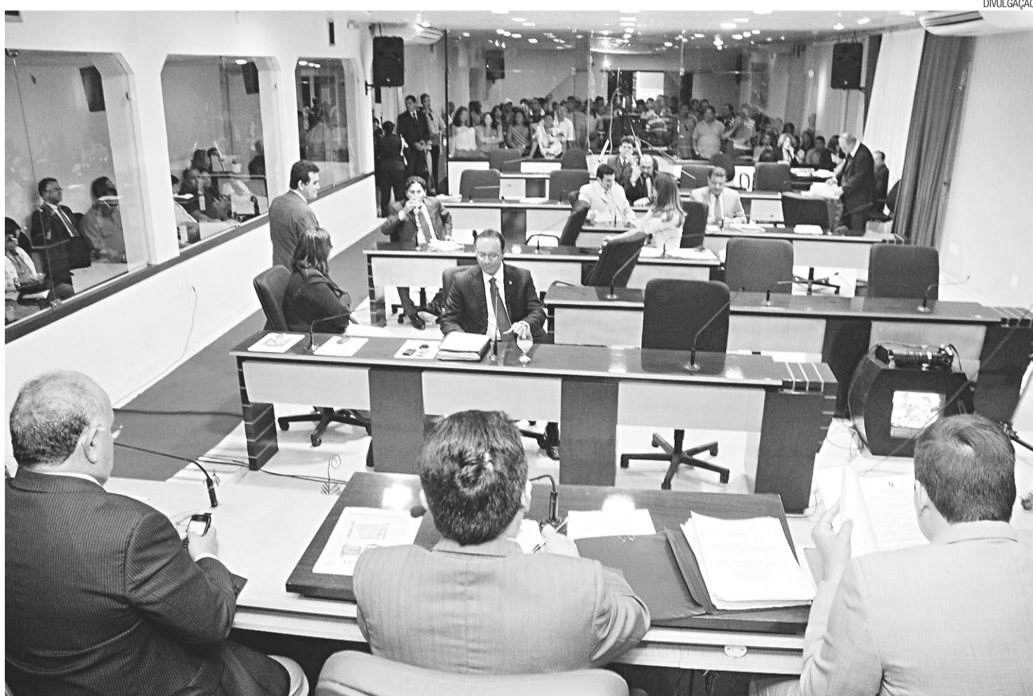
▶ Sessão realizada em regime de urgência aprovou projeto de lei com 16 votos

Os desembargadores consideraram inconstitucional a falta de previsão na lei municipal da participação de representantes do Poder Público e de membros da comunidade em um conselho de deliberação superior. Sem essa previsão, as Organizações Sociais que