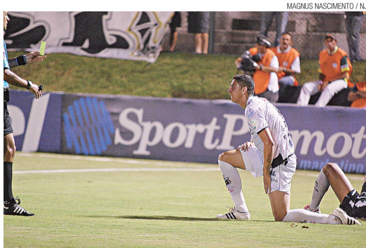
► Punição com cartão amarelo é cena corriqueira no alvinegro

Mas nem sempre são as "pancadas" responsáveis pelas sucessivas punições. Reclamações, atraso na reposição de bola, simulação e todo o leque de lances antidesportivos são utilizados para tentar evitar que o adversário possa levar vantagem nas jogadas. O ABC, por exemplo, tem sido bem eficiente ao exercer a prática. O alvinegro potiguar é a terceira equi-