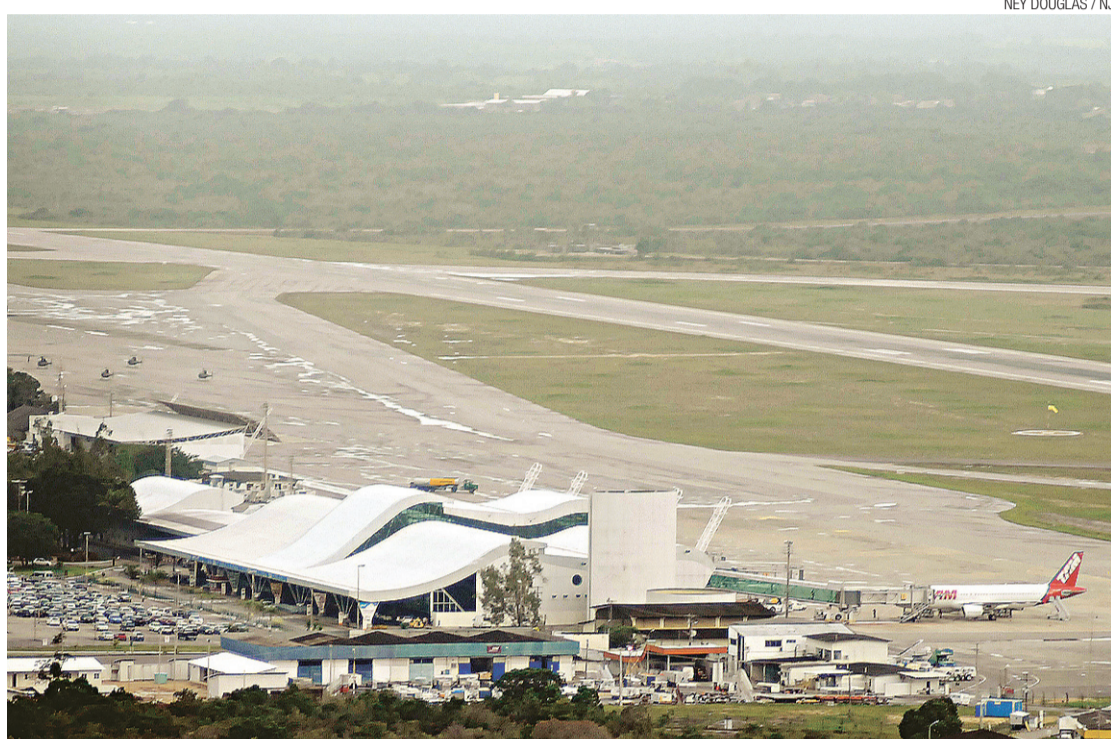
▶ Augusto Severo será reformado até o ano que vem

A chefe do executivo ainda não sabe mensurar quanto as reformas irão custar ao governo federal, já que os projetos de modernização ainda estão em fase inicial. Mas estima que os gastos não sejam menores do que R$ 10 milhões. “Agora em outubro vamos ter uma reunião com a Infraero para levar essas demandas e necessidades e es-