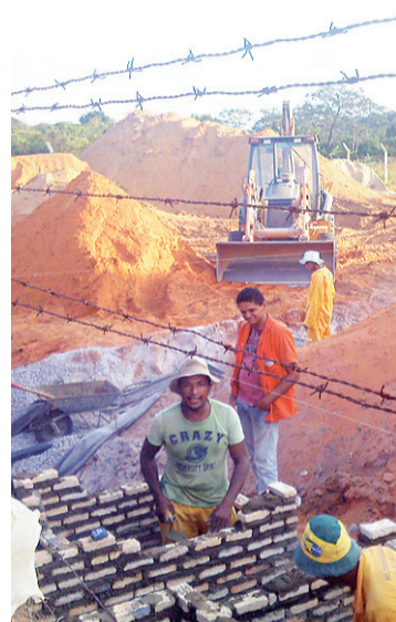
► Obras realizadas pela Caern em Alcaçuz devem liberar novo pavilhão