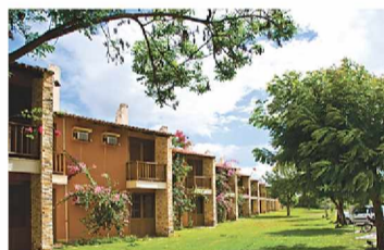
► Rede hoteleira mossoroense conta com 1.800 leitos