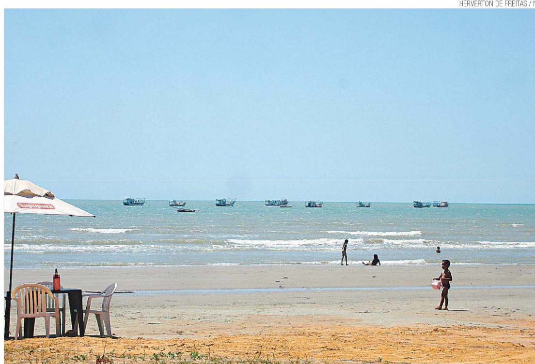
► Praia de Tremembé