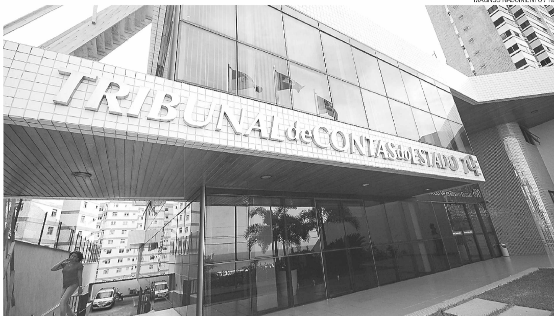
► Tribunal de Contas do Estado quer conhecer números da empresa

Ao presidente do TCE, Tarcísio Costa também pede que "avergue a existência de processo de inspeção ou denúncia relacionada à Agência de Fomento do Rio Grande do Norte (AGN), tendo em conta exorbitante prejuízo nos balanços desta entidade quando da