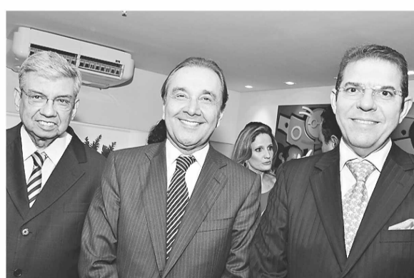
► O senador José Agripino entre o ministro da Previdência, Garibaldi Filho, e o desembargador Marcelo Navarro