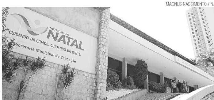
► Aluguel do antigo Novotel será investigado pela comissão

No ofício, a presidente solicita que o plenário da Câmara seja reservado às segundas-feiras a partir das 14 horas para as reuniões públicas, inclusive a tomada de depoimentos com transmissão ao vivo pela TV Câmara. "Estabelecemos um cronograma e acreditamos que vamos cumprir o prazo de 120 dias de trabalhos sem necessitar de prorrogar".