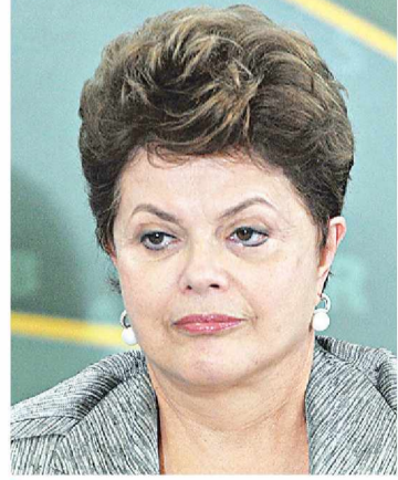
► Dilma quer apoio do Congresso

ser aprovada por três quintos da Câmara e do Senado, com duas votações em cada uma das Ca-