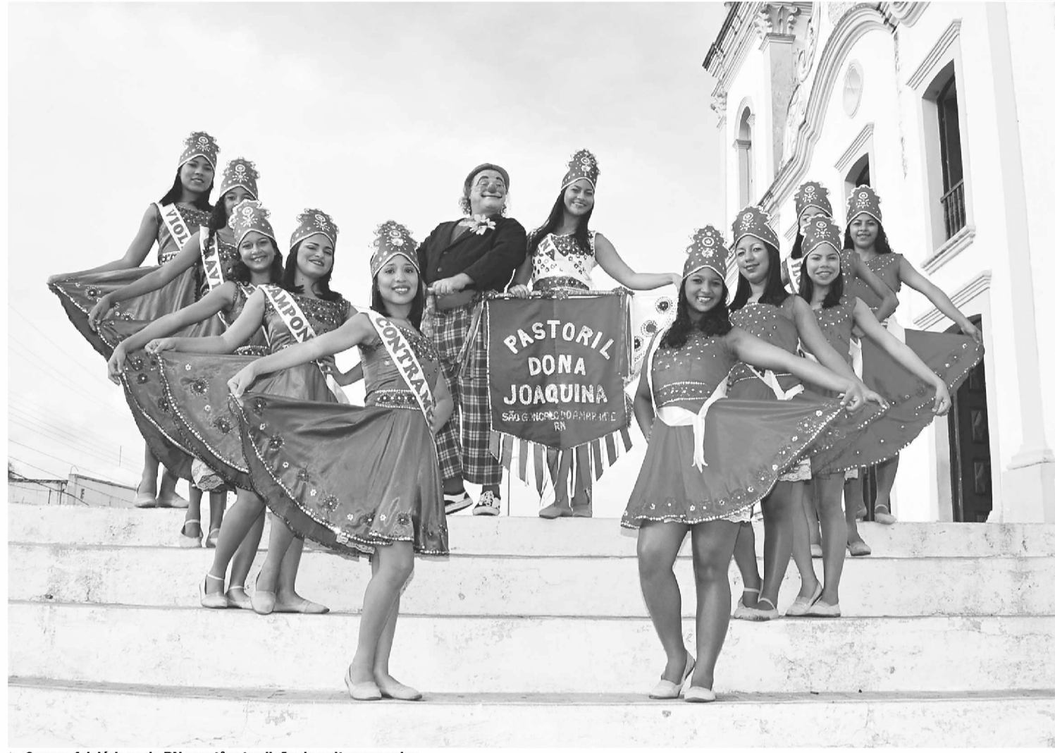
▶ Grupos folclóricos do RN mantêm tradição da cultura popular