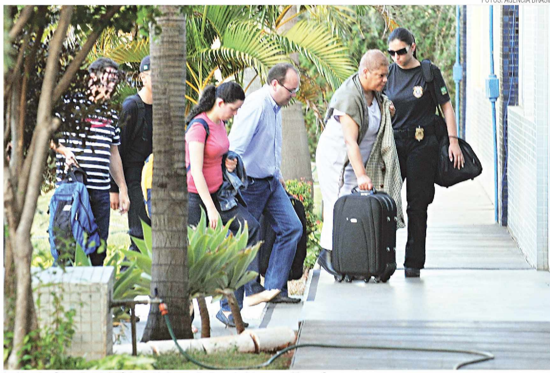
► Funcionários do Ministério do Turismo são transferidos para Macapá