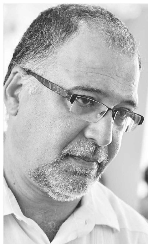
▶ Roberto Schmidt Prym, chefe de gabinete do governo gaúcho: investimento no turismo interno