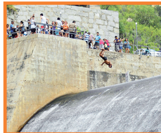
▶ Rapaz desafia o perigo e salta de cabeça no Gargalheiras