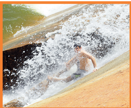
▶ Garoto toma banho na sangria do Gargalheiras