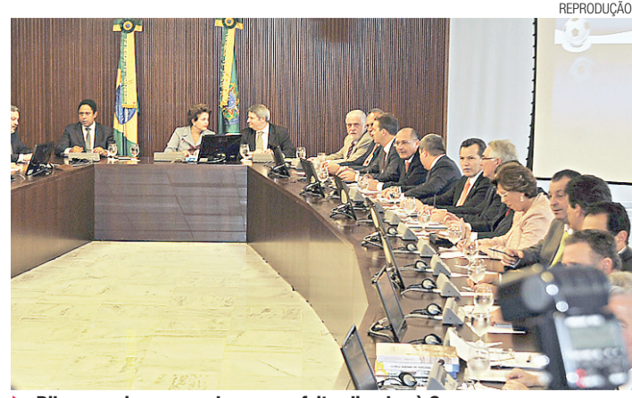
▶ Dilma reuniu governadores e prefeitos ligados à Copa

De acordo com informações da embaixada coreana no Brasil, as visitas começaram a ser projetadas mais de um ano atrás. Por indicação do Governo Federal, todos os estados da região Nordeste foram procurados. Os primeiros a responder foram Rio Grande do Norte e Pernambuco. Outros dois estados devem receber novas missões nos próximos três meses.