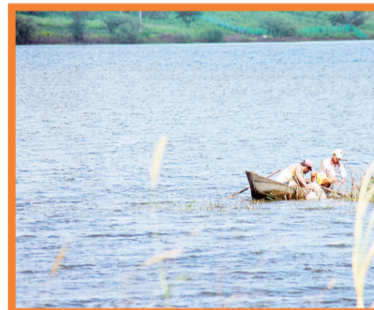
▶ Pescadores no açude Inharé, em Santa Cruz