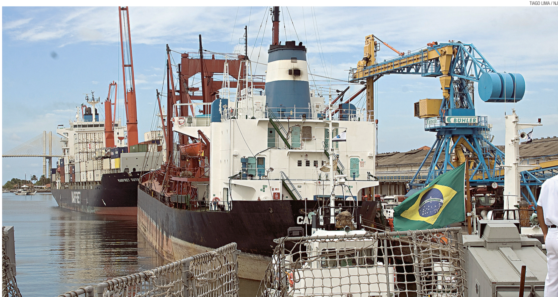
► Proimport incentiva importações através do porto de Natal

Apesar disso, ele não demonstrou maiores preocupações com o resultado e disse que