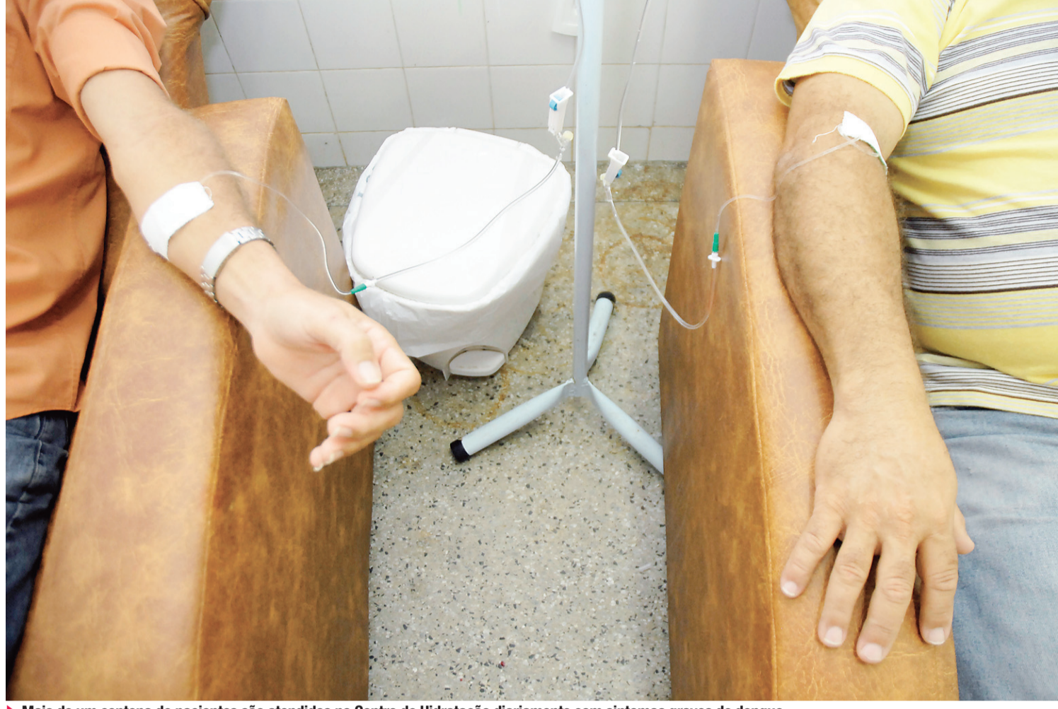
► Mais de um centena de pacientes são atendidos no Centro de Hidratação diariamente com sintomas graves de dengue

Por fim, ele explica como é o processo para utilização de um determinado medicamento. Primeiramente, há o início dos testes laboratoriais que pesquisam a eficiência de um determinado composto químico. Em seguida, o laboratório inicia os testes pré-clínicos, para analisar a toxicidade. O passo seguinte é a fase clínica. O laboratório, neste caso, inicia o estudo da dinâmica do fármaco no corpo humano. Logo em seguida, dá-se a fase de teste em humanos e o ensaio clínico, que compararam o novo tratamento às antigas práticas farmacológicas. Por fim, há a análise de efetividade, que verifica possíveis efeitos colaterais.