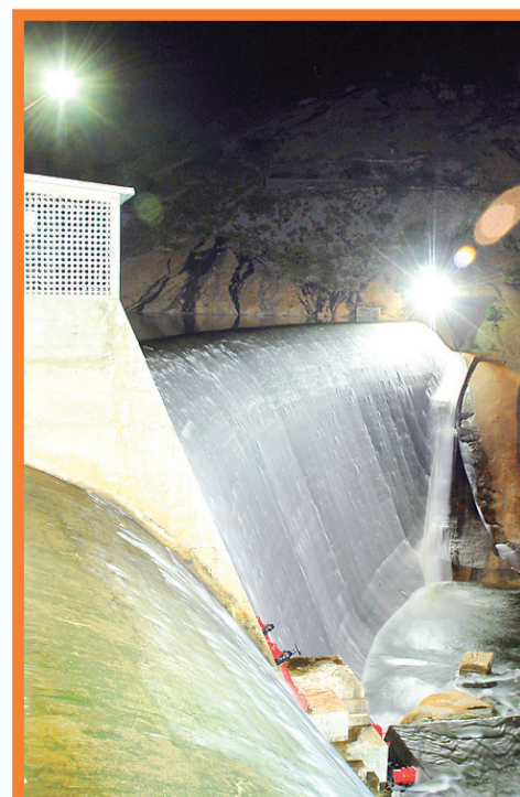
▶ Gargalheiras à noite: "Véu de Noiva"