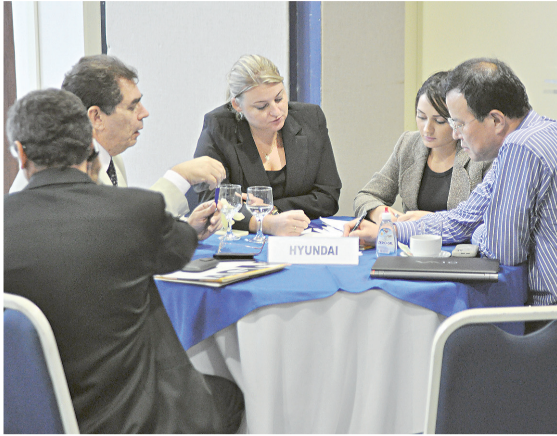
▶ Executivos analisaram propostas de investimentos

Construído em 2001, o aeroporto internacional de Incheon é,