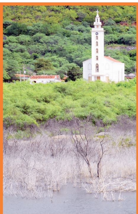
▶ Açude e igreja da Mina Brejuí, em Currais Novos

De um potencial de 4.888.921.016 m 3 de água, os reservatório potiguares armazenam 4.487.970.173 m 3 , ou 91,80% da capacidade total. Na conta entram apenas os grandes açudes e barragens do Rio Grande do Norte. De acordo com os dados mais atuais da Secretaria de Meio Ambiente e dos Recursos Hídricos, Pau dos Ferros, Santa Cruz (Apodi), Umarí (Upanema), Itans (Caicó), Sabugi (São João do Sabugi) e Boqueirão (Parelhas) ainda não sangraram.