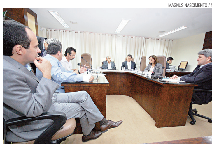
► CCJ rejeitou projeto

Quanto aos questionamentos sobre a constitucionalidade de medidas semelhantes já adotadas em outros Estados, o secretário lembrou que o Supre-