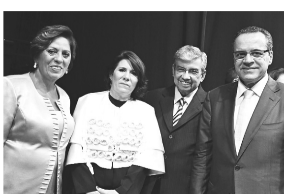
A nova reitora entre a governadora Rosalba Ciarlini, o ministro Garibaldi Filho e o deputado federal Henrique Alves