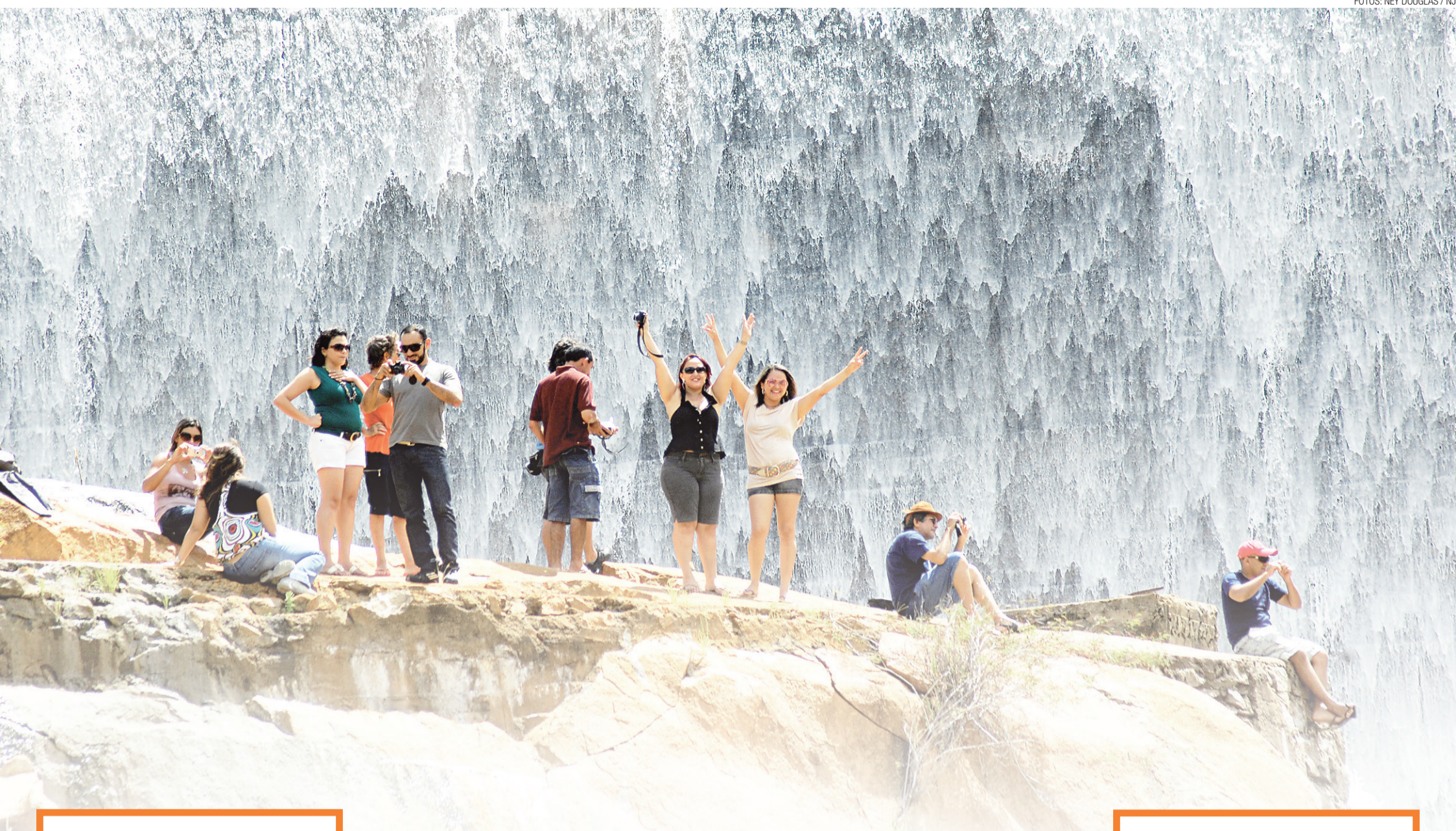
▶ O rio Acauã; turistas em um dos paredões rochosos do Gargalheiras e a pesca sossegada de pai e filho: inverno!