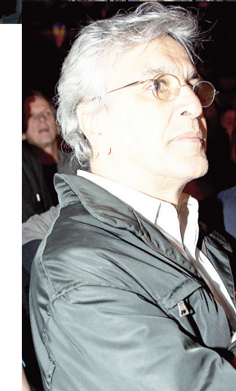
▶ Caetano Veloso confere o show da Orquestra Imperial