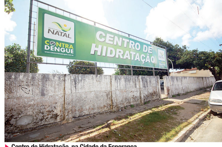
► Centro de Hidratação, na Cidade da Esperança

A decisão do Tribunal de Justiça do Rio Grande do Norte que declarou inconstitucional a lei 6108/2010 que rege a contratação de organizações sociais da prefeitura ainda não foi publicada. De acordo com o procurador do município