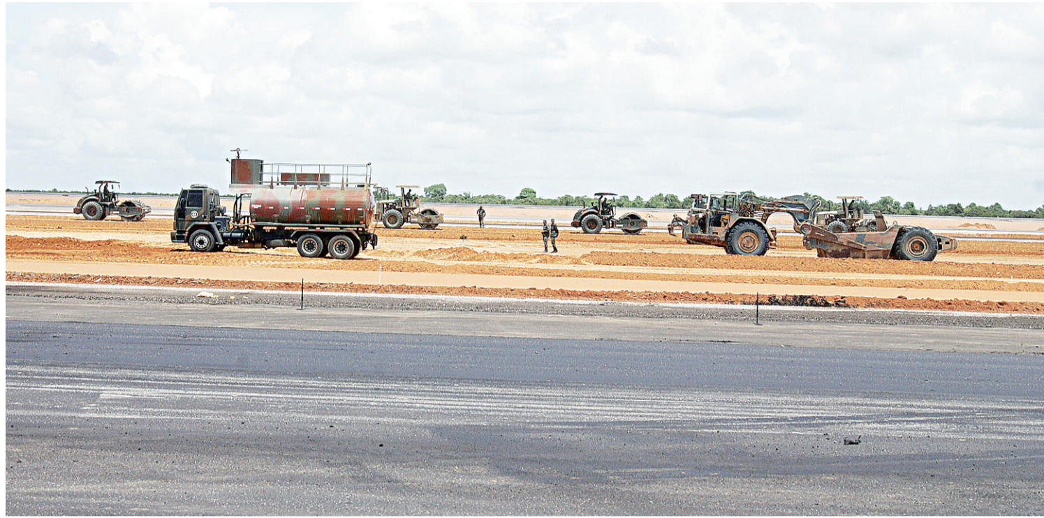
▶ Exército está construindo as pistas do aeroporto

As regras limitam a participação de empresas de aviação a 10% do capital com direito a voto. A estimativa é de que o consórcio vencedor do leilão in-