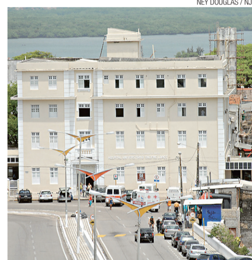
► Hospital Universitário Onofre Lopes