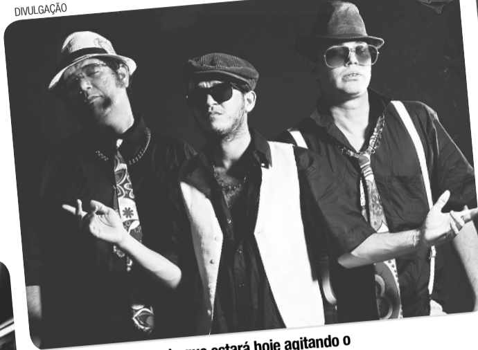
▶ A galera do DuSouto que estará hoje agitando o Dom Vinicius com seu som moderno

No Forró do Pote, rola o melhor São João fora de época da região com Dorgival Dantas, Amazan & Forró Ôta Banda a partir das 22h.