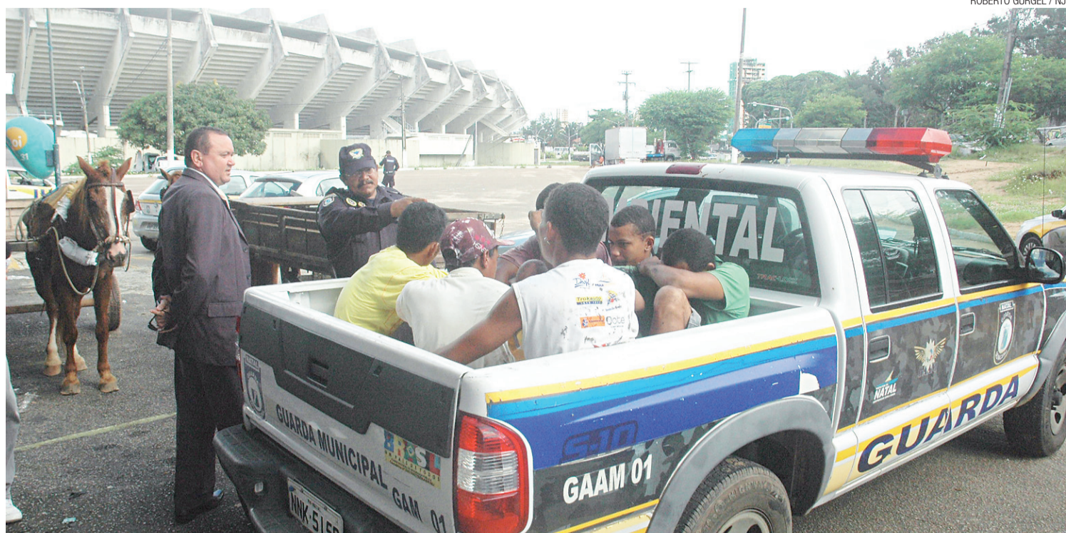
► Guarda Municipal recolhe homens flagrados no Machadinho

Portas nem pensar. Nos banheiros a situação é ainda pior. Todo o encanamento foi arrancado e o mau cheiro lembra o necrotério do Itep. Fezes e urina se misturam à lama. Com as chuvas, há muita lama e poças d'água por todos os cantos.