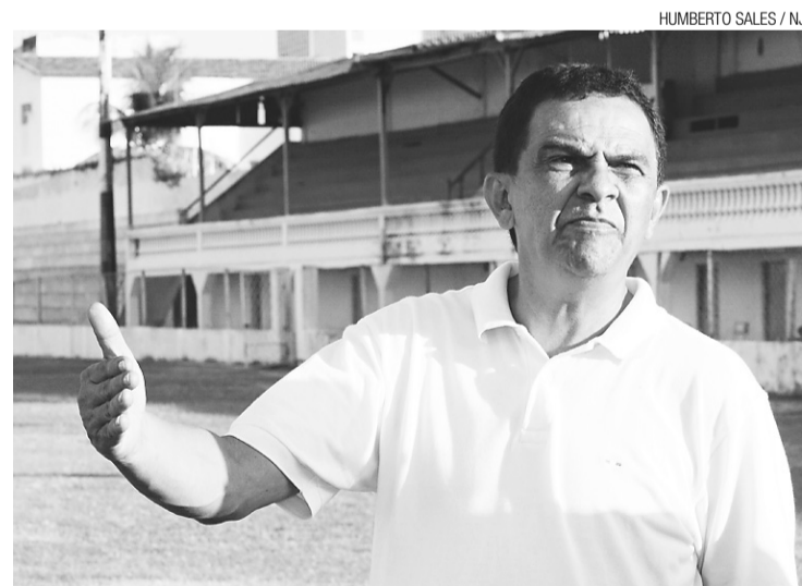
► Diá prepara o time para a disputa da Série C

Mas a apresentação dos atletas pode ser antecipada, tudo vai depender do começo do Campeonato do Nordeste. "Existe a possibilidade o Campeonato do Nordeste começar no início de julho. Se isso acontecer é provável que os jogadores voltem no dia 15", frisou.