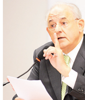
▶ Nelson Jobim