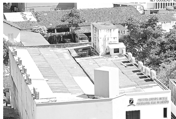
Reservatório destampado na PGM preocupa vizinhos