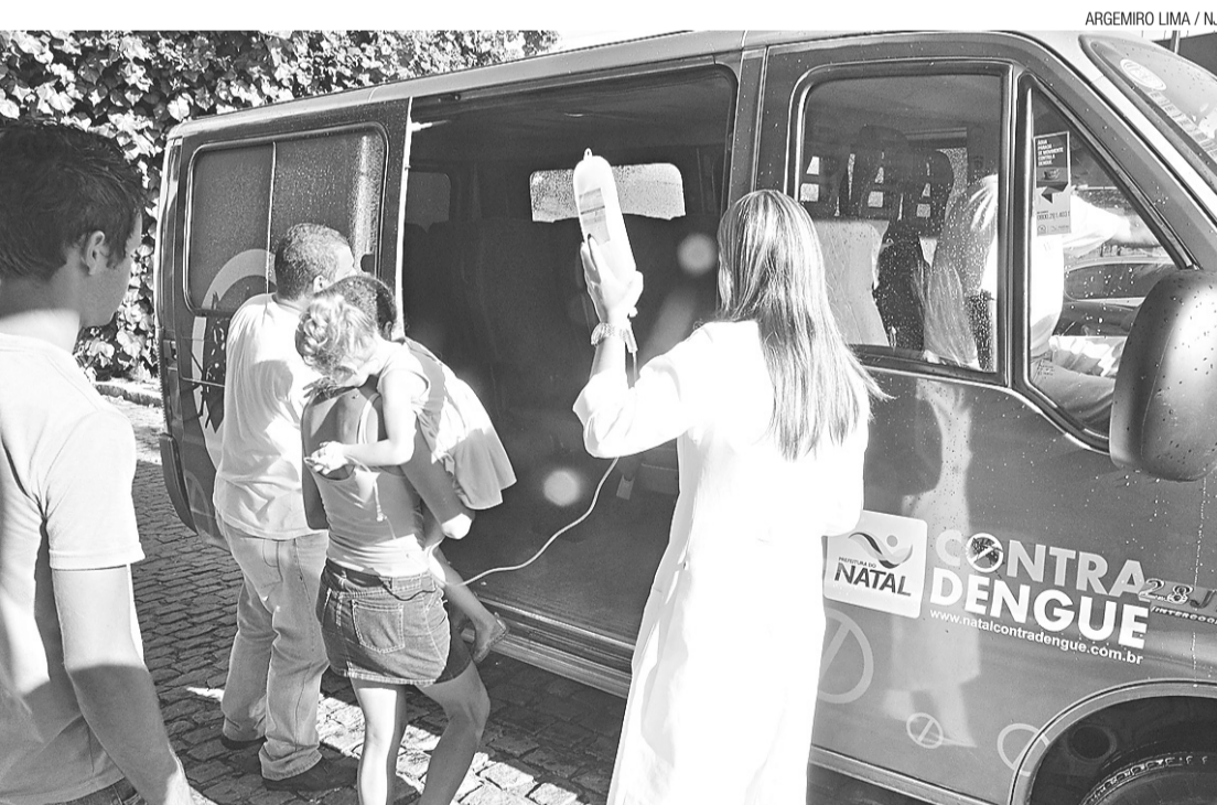
Atendimento na van do programa de combate à dengue

lor unitário de R$ 11,25: operacional, administrativo e impostos somam R$ 2,25; além de R$ 9,00 de insumos.