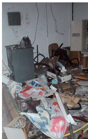
► Ginásio depredado