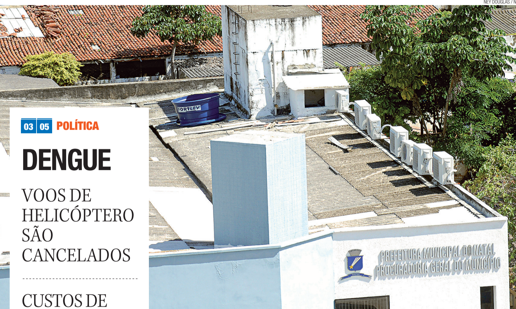
NEY DOUGLAS / NJ

/ INFRAESTRUTURA / EDITAL DE LICITAÇÃO DA CONCESSÃO DO AEROPORTO DE SÃO GONÇALO SERÁ PUBLICADO SEGUNDA-FEIRA E A ESCOLHA DA EMPRESA RESPONSÁVEL PELA CONSTRUÇÃO DOS TERMINAIS DE CARGA E PASSAGEIRO ESTÁ MARCADA PARA O COMEÇO DO MÊS DE JULHO