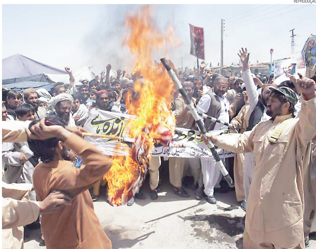
▶ Paquistaneses queimam bandeira americana em protesto

A Al Qaeda anunciou ainda que tem uma mensagem de áudio gravada por Bin Laden uma semana antes de sua morte e que deve divulgá-la em breve. "Antes do xeque passar deste mundo e antes dele poder dividir com a nação islâmica as alegrias de suas revoluções diante dos opressores, ele gravou uma mensagem de voz de congratulações e conselhos que divulgaremos logo. Que Deus queira", disse o grupo terrorista.