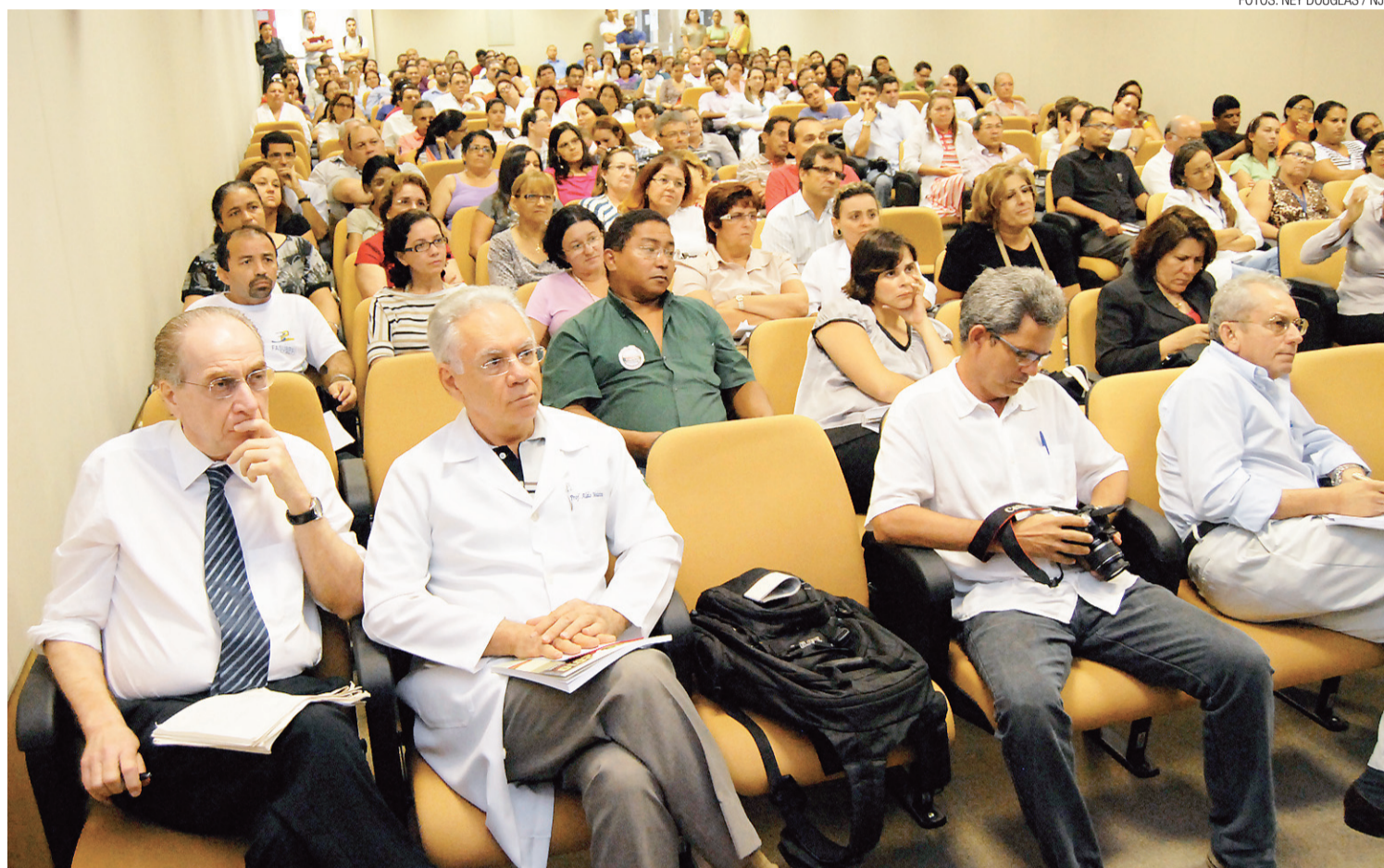
► Gestores e profissionais da área de saúde iniciam discussão sobre a MP que cria a Empresa Brasileira de Serviços Hospitalares

Ele revela que o modelo se baseia no Hospital das Clínicas de Porto Alegre, que hoje dispõe de 700 leitos e R$ 600 milhões no orçamento por ano. "É uma empresa pública de direito privado que há 40 anos faz o hospital funcionar. É um modelo de empresa cujas ações são 100% do governo, totalmente dirigida para atender o SUS e prestar auxílio aos hospitais universitários no cumprimento da