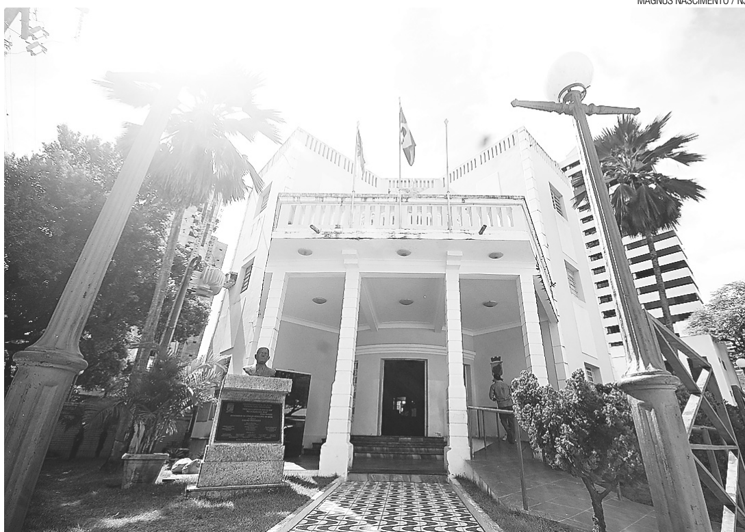
► Câmara Municipal volta a apreciar revisão do Plano Diretor

Outro trâmite se desenrola nas Comissões da Câmara, onde os vereadores analisam e também sugerem emendas. O Projeto de Lei pode ficar um dia ou mais de um mês em uma ou várias Comissões. Novas assembleias públicas podem ser requeridas antes que o texto, emendado, vá à votação do plenário. Por ser uma