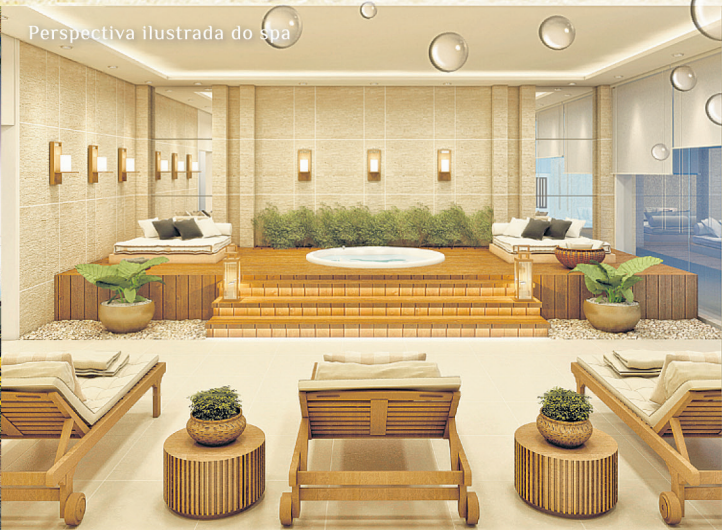
Perspectiva Ilustrada do spa