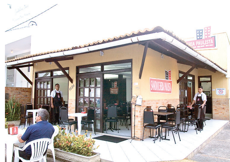
► Lanchonete começou num trailer (acima) e está pequena para movimento