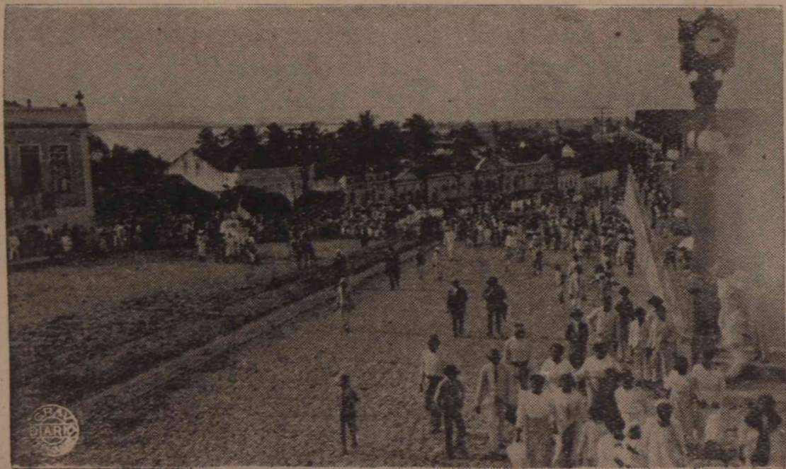
Prestito na Rua Junqueira Ayres.