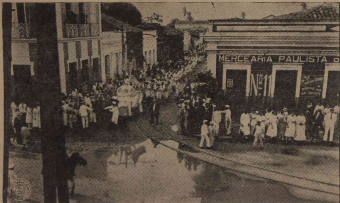
Prestito na rua Frei Miguelinho. Carro triumphal e Grupo Escolar "Frei Miguelinho".